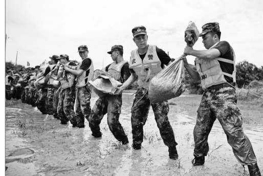
7月12日，武警江西总队机动支队官兵在鄱阳县鄱阳县昌江圩传递沙袋。