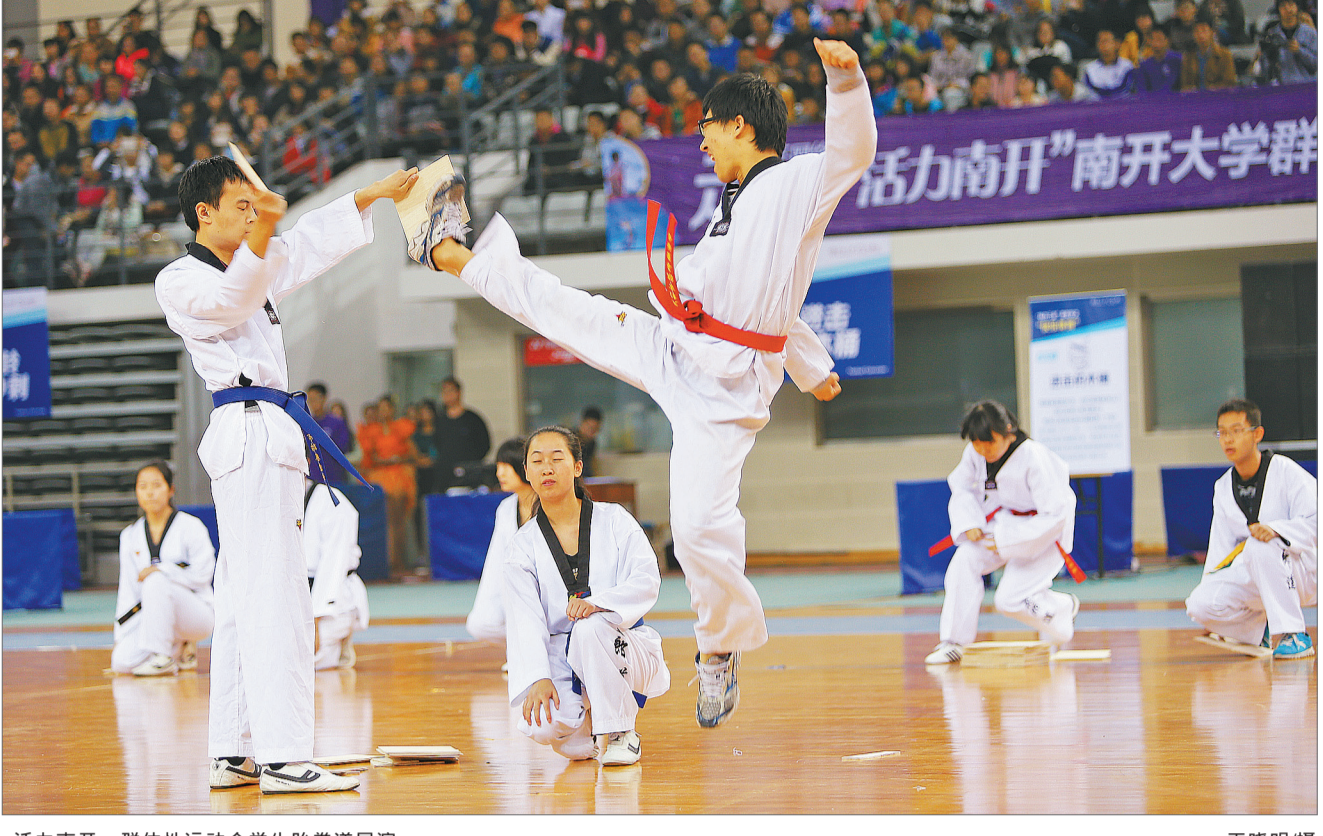
活力南开 群体性运动会学生跆拳道展演。

2017年，南开大学首次向毕业生颁发“体质健康证”，发放比例只有37.1%。4年来，这一比例逐年提升，今年达到了58.7%。但即便这样，仍有40%以上的毕业生无法拿到“体质健康证”。王宗平表示，南开大学敢于每年公布自己有多少学生拿到