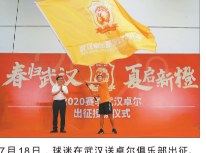
7月18日，球迷在武汉送卓尔俱乐部出征。