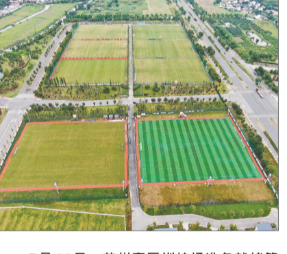
7月14日，苏州赛区训练场准备就绪等待球队抵达。