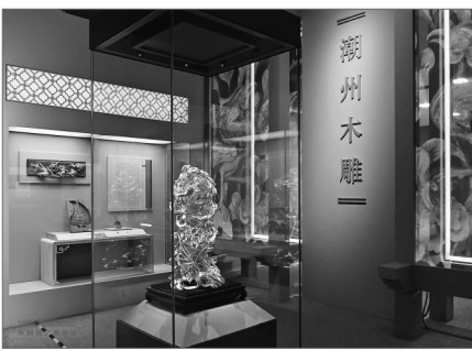
展厅内景，中间展品为《金漆通雕龙虾蟹蟹》。