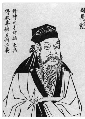
司马懿，此图出自明刊本《历代人物像赞》。

三国故事和三国人物流传上千年，妇孺皆知，但不同的人对三国的认知是不一样的。事实上，我们所熟知的三国早已超越历史本身，主要包括三部分：一是《三国志》《晋书》《资治通鉴》等正史中所写的三国；二是历史小说《三国演义》中所描述的三国；三是从古至今长期通过民间传说、神话故事、戏剧、说唱等各种艺术形式流传下来、固化在人们心中形成的文化三国。而在普通大众中，《三国演义》所描述的三国和文化三国因故事跌宕起伏、人物性格特点鲜明，更容易被接受和传颂，正史中的三国反而很少为人所知。