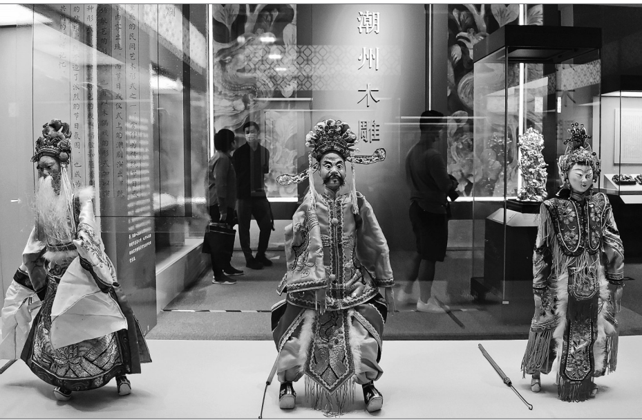
铁枝木偶 齐王求将。