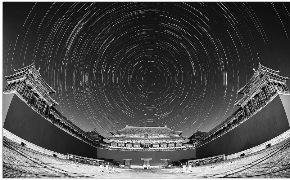
故宫午门星轨。

北斗七星是古人观察农时、管理农事的重要依据。《逸周书·周月解》有（一月）斗柄建子，始昏北指，阳气亏，草木萌动。《尚书·舜典》中有舜即位后在璇玑玉衡，以齐七政的记载，《史记》对此的解释是北斗七星，所谓璇玑玉衡，以齐七政，《尚书大传》曰七政，谓春、秋、冬、夏、天文、地理、人道，所以为政也，意即舜通过观察北斗七星运行规律，带动节序，判分寒暑，辨别四季轮换，带领民众安排农业生产等事务。