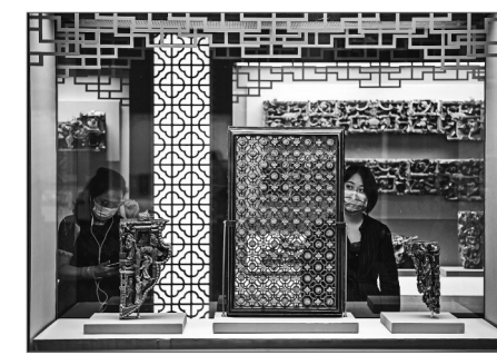
观众正在看展。