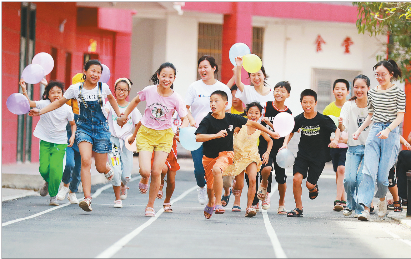
7月26日,是桂林旅游学院放暑假的第一天,支教的师生们又一次来到中峰村,通过做游戏和走村入户的方式,教山区孩子们英语。这也成为了当地孩子们2020年暑假的特殊第一课。2018年3月,桂林旅游学院在扶贫中获知,桂林市资源县中峰镇中峰村的孩子们英语基础薄弱,该校外国语学院挑选出一批品学兼优的英语专业大学生和英语教师,组建了英语支教队伍,利用假期和课余时间,经常深入山村进行英语教学,让高校教师指导小学教师,让大学生教小学生,并量身订制了零基础班、初级班、中级班以及高级班,因材施教。

作为教师,首先就不能认为教师职业是没出息,给学生灌输“不要上师范”的错误理念,要让学生全面理性看待教师这一职业。为师范正名,先自教师起,再逐渐形成尊重师范选择的社会风气。