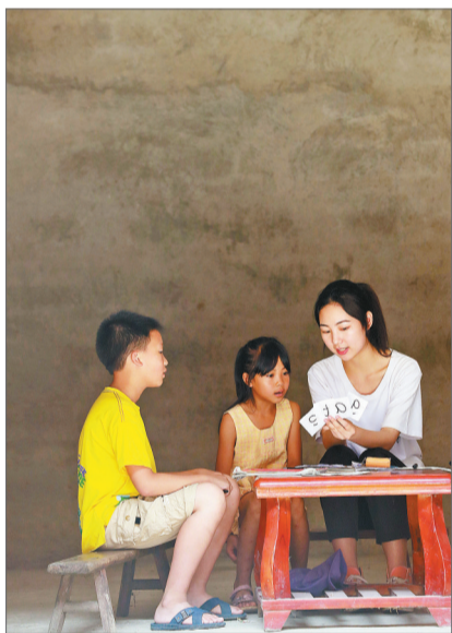
7月26日,广西桂林,来自桂林旅游学院外国语学院的大学生(右一)正在农户家给孩子教英语。