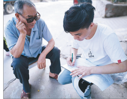
20多名返乡大学生来到河北省唐山市玉田县,在当地疾控中心的指导下开展居民健康素养水平的动态监测。