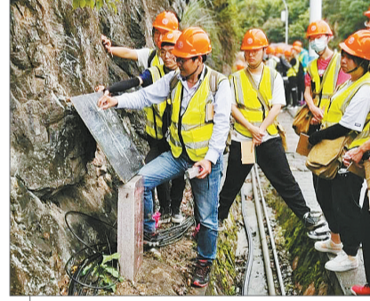
中国地质大学(武汉)的同学们在老师的带领下到野外开展地质实习。