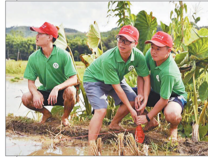
赣南师范大学的同学们走进田间地头,帮助缺少劳动力的家庭抢收、抢种。

大学生的暑假生活可以有丰富多彩... 去野外考察实习、帮老乡播种和收获、当一回小老师... 利用假期去了解社会、了解自然... 这个暑期,在社会的大课堂里给自己充充电。