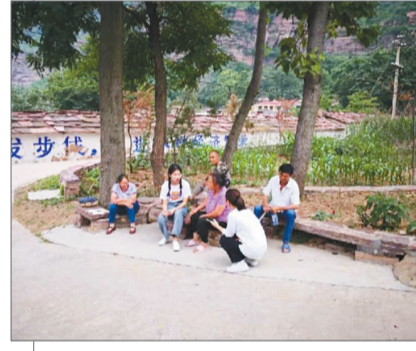
郑州大学新闻与传播学院组建“红旗渠调研 社会实践队”,前往河南省安阳市林县红旗渠开展暑期三下乡社会实践活动。