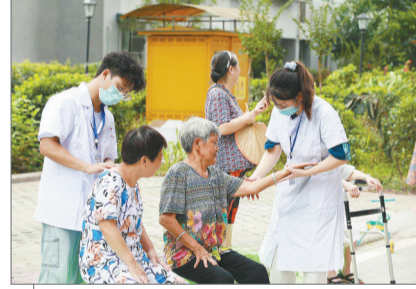
重庆城市管理职业学院2020大学生暑期返乡社会实践活动爱心医疗服务团走进社区,开展社区医疗服务。