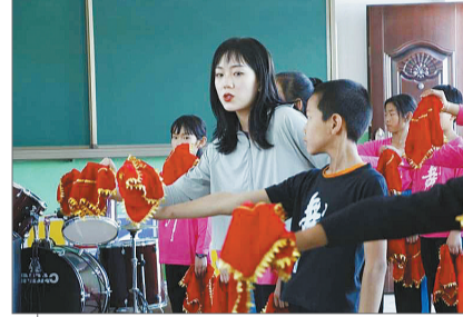
西北师范大学社会实践队赴会宁县大沟镇开展美育支教,支教老师正在给学生上民族舞课。