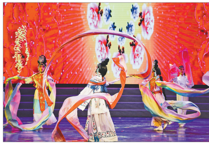
2017年，山东省济南市天桥区中小学生学习京剧艺术节在济南举行，学生们翩翩起舞，尽展艺术风采。

洗脸、换水衣子，再到化妆台前抹彩、勾脸；梳大头、贴片子、插戴袍子；彩裤彩鞋以及厚底靴；勒头吊眉，再到衣箱那里穿打衣靠衣、系褶子大带、绦子和那靠旗。暗娇妆画眉，私语口脂香。看着镜中穿戴好的我，竟有一丝不真切。换好扮装的先生，微笑着看着我：不必紧张，融入