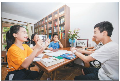
佛山市禅城区书香乐园 邻里图书馆,小读者们正在对书中的知识进行互动。

黄百川坦言,一开始做邻里图书馆,并没有太大自信,本地人可能不太愿意和身边的陌生人交流,所以前期花了很大力气去推广。在这过程中发现,亲子阅读是很好的切入点。