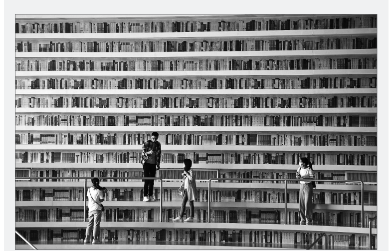
9月12日，读者来到天津滨海新区图书馆参观。天津滨海新区图书馆于9月12日起全面恢复开放，以满足读者阅读需求，丰富群众文化生活。有着“滨海之眼”之称的滨海新区图书馆位于天津滨海文化中心，于2017年10月正式开馆，目前已成为滨海新区的文化新地标。