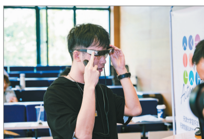
天津大学宣怀学院的学生正在进行课结项目路演。