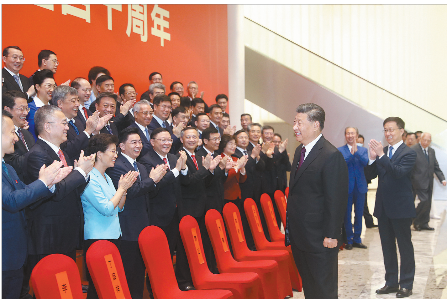
10月14日,深圳经济特区建立40周年庆祝大会在广东省深圳市隆重举行。中共中央总书记、国家主席、中央军委主席习近平在会上发表重要讲话。