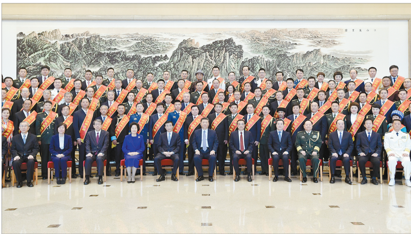
10月20日,党和国家领导人习近平、李克强、王沪宁等在北京会见全国双拥模范城(县)命名暨双拥模范单位和个人表彰大会代表。

李克强说,党的十八大以来,在以习近平总书记为核心的党中央坚强领导下,各地区各有关部门积极支持和服务保障军队建设改革,进一步加大优抚安置保障,军队支援经济社会发展积极有为,在参与重大自然灾害抢险救援和应对突发事件中当先锋,今年面对疫情,人民子弟兵闻令而动、敢打硬仗,广大军民携手同心、共克时艰,取得了抗击疫情斗争重大战略成果,彰显了军民团结的强大力量。(下转3版)