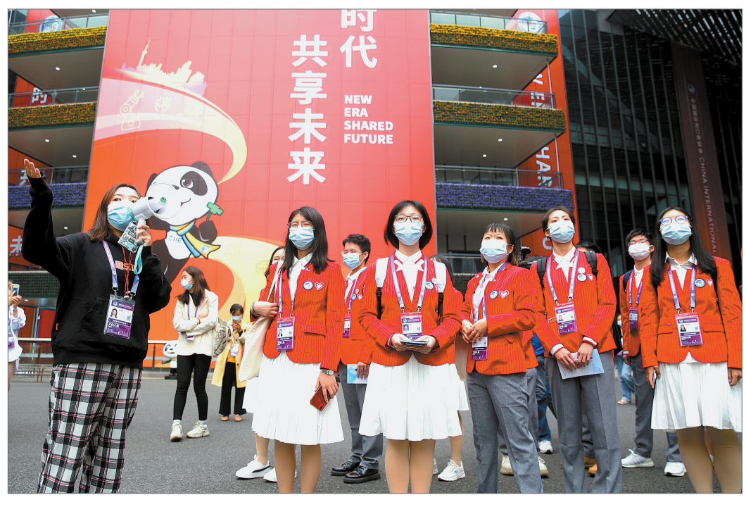
10月28日，志愿者们在巡馆。当日，第三届中国国际进口博览会的近千名志愿者分时段、分批次进入国家会展中心(上海)巡馆。志愿者小叶子们在老师的引领下，详细了解场馆、展厅和重要标识，并结合地图实地行走，以更快地熟悉场地；另有约160名咨询引导岗位志愿者进入岗位实训。

全会提出，形成强大国内市场，构建新发展格局。当前和今后一个时期，我国发展仍然处于重要战略机遇期，但机遇和挑战都有新的发展变化。因此，必须加快建设现代化经济体系，加快构建以国内大循环为主体、国内国际双循环相互促进的新发展格局，全面促进消费，拓展投资空间。