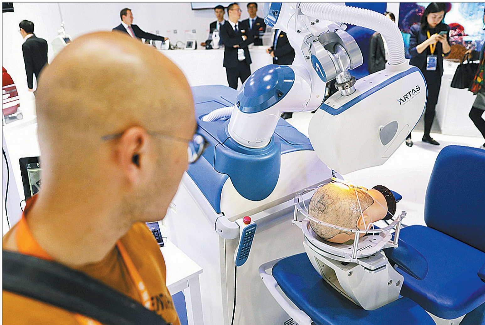
2019年11月6日,上海,一款植发手术辅助机器人首次亮相第二届进博会。该设备在一小时内可以帮助患者植发1500根。

今年十一月,也是我植发的第150天,头发长了不少。但我也踏实,是不是最后3个月的生长期提前来了?会不会出现什么状况?虽然最终怎么样不得而知,但我这半年来,把烟戒了,酒也尽量不喝了,毕竟头发还挺贵的。