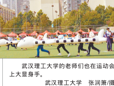
武汉理工大学的老师们也在运动会上大显身手。