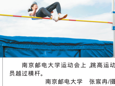
南京邮电大学运动会上，跳高运动员越过横杆。