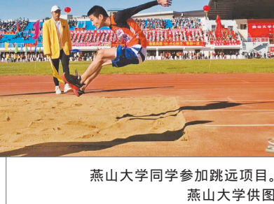
燕山大学同学参加跳远项目。