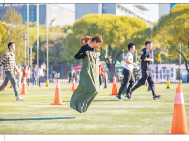
北京林业大学运动会上的袋鼠跳项目。