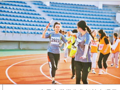
南昌大学学生参加接力项目。