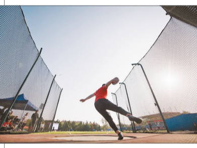
浙江大学运动会上，运动员即将抛出铁饼。