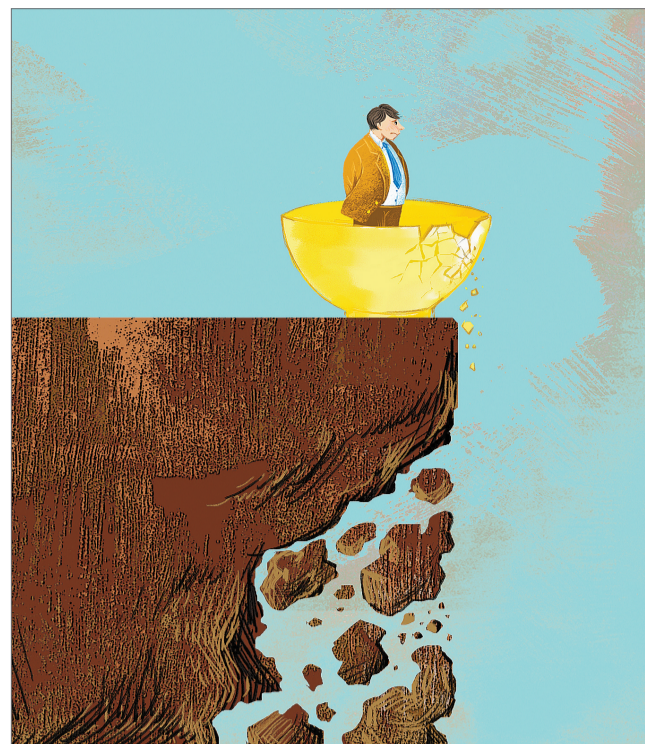
年轻人求职者对银行“金饭碗”的认同正在发生变化。

只有在开阔的原野上，幼苗才能长成参天大树，一个行业如果想要吸纳新鲜血液，保持对优秀青年的吸引力，就必须给年轻人提供充足的发展空间。同样是同侪竞争，有些领域的竞争能够让年轻人得到切实的成长，同时为社会创造额外的效益，也有一些领域的竞争，不过是同龄人之间互相倾轧，只为争抢一块已有的蛋糕。对今天的年轻人而言，前者才是更理想的工作状态，后者只不过是毫无意义的“内卷”。