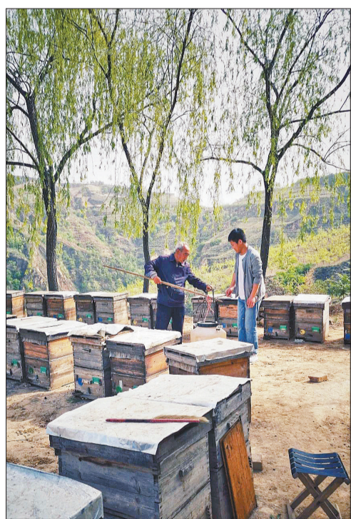
创新者的味觉，要做中国人自己的蜂蜜

无人污染的纯净生态环境，加上这里气候干燥，紧邻黄河水道，辅当地数百年沿袭至今的养蜂传统，石楼优越的蜂业生态环境稀有天成。