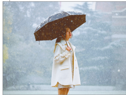
初雪落下,一位女生在雪中驻足。