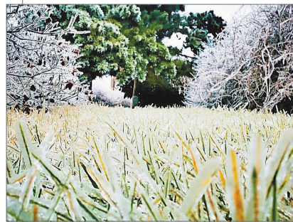
吉林大学校园一角,树木的枝丫和仍然翠绿的草叶被晶莹的冰包裹,宛若刚刚历经一场魔法。

投的群体。但是,通过弹幕他们可以快速找到自己的归属群,同时达到消除孤独感的目的。