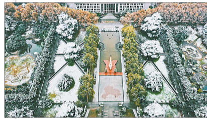
航拍西安交通大学校园,大地被白雪覆盖。