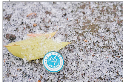
严寒的空气里,落下的雪在地面结成小冰晶。