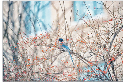
初雪中,一只蓝色羽毛的小鸟栖息枝头。