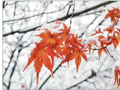
西电的红枫遇见洁白的雪。

当青春遇上最浪漫的初雪,天地仿佛经过一场魔法。一夜之间,一砖,一瓦,一花,一叶,相约共赴白头。在雪世界里,想象力长出翅膀,按捺不住喜悦的心情,把雪玩出百般花样。