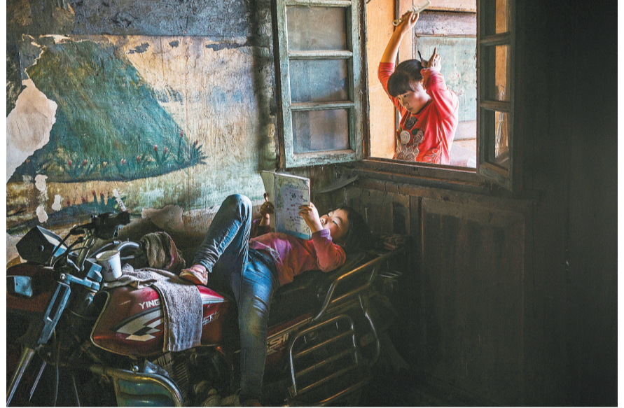
2016年6月2日,寻甸县苏撒坡彝族村,留守的一对姐妹。父母在外地打工,在乡上念初中的姐姐和在村小读书的妹妹周末才能见面。

随着风电项目建成,先进的风机和原始的劳作构成了一幅幅对比强烈的画面,这座封闭的彝族小村也渐渐融入现代化的浪潮,在艰难中逐渐走出贫困。像密枝林的古树一样,苏撒坡的村民在跌宕起伏的历史长河中表现出的坦荡与坚韧,动人心魄,令人肃然起敬。2016年,苏撒坡村有人口258户1126人,其中建档立卡贫困户115户414人。2018年,村里所有建档立卡贫困户已全部脱贫出列,通过了国家验收。