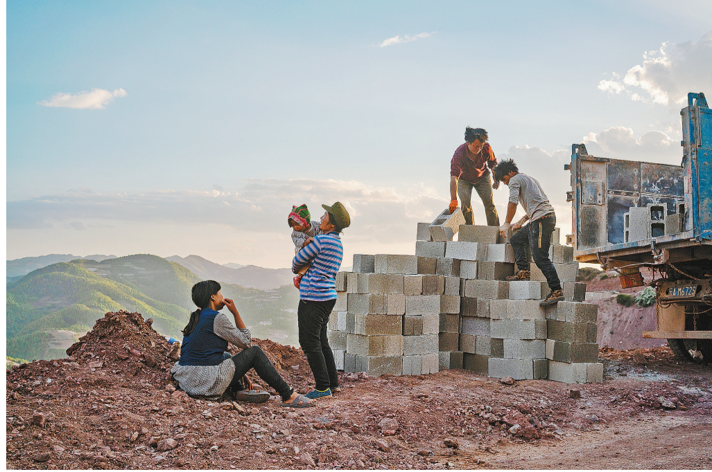
2018年5月2日,寻甸县苏撒坡彝族村,两家人互相帮忙建新房。政府扶贫期间启动了安居工程,将危房鉴定后统一拆除重建,给每户5.1万元补助。