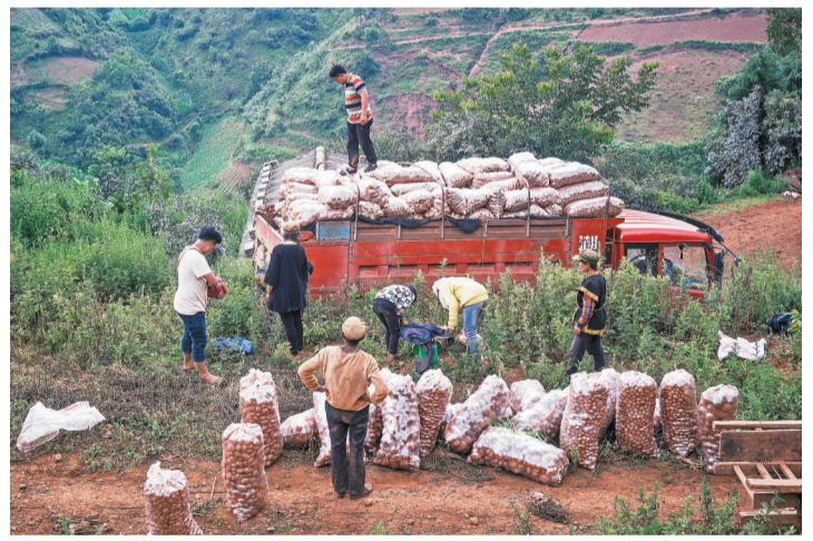
2018年7月22日,寻甸县苏撒坡彝族村,洋芋收获季节,收购商直接将卡车开到田边收购。洋芋、油菜籽等作物是当地村民的主要经济收入来源,得益于扶贫项目,耕地边都修建了公路。