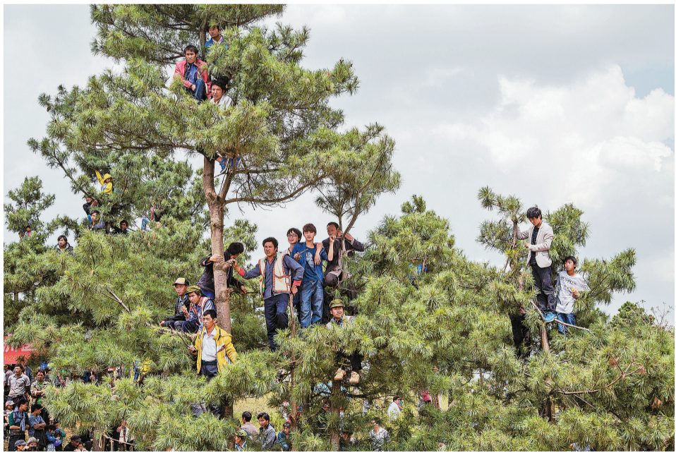
2013年8月7日,寻甸县苏撒坡彝族村,村民站在树上观看立秋节的斗牛比赛。