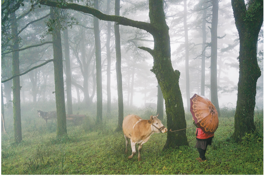
2019年9月10日,寻甸县苏撒坡彝族村,风车下的密枝林。密枝社被彝族视为圣之地,任何人不得以任何理由进行破坏,遇到通水、通路、祭山等重大事时,村民会在林里聚餐庆贺。

云南省寻甸县是我的家乡,这里的古树林中坐落着寻甸最大的彝族村落,名叫苏撒坡,彝语里称为密枝社,意为密枝神殿。过去几年来,我曾数百次来到这里。