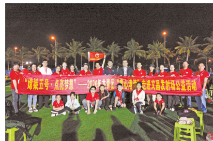
共青团 童心港湾 全国项目办组织开展 嫦娥五号 点亮梦想 活动。