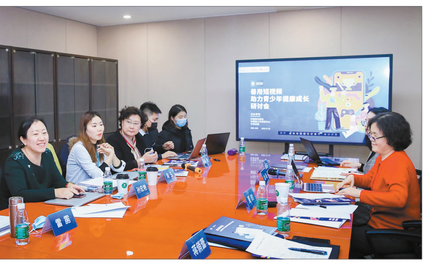
善用短视频助力青少年健康成长研讨会现场。

95后所属的Z世代是网络原住民，与生俱来的互联网基因，让网络媒介环境注定成为他们生活的重要组成部分。近年来短视频兴起，融入青少年的学习、生活，也引发了青少年研究工作者的思考。在研讨会上，来自教育学、社会学、传播学、心理学、青少年权益保护等领域的专家就从不同维度，共同探讨怎样用好短视频，助力青少年健康成长。