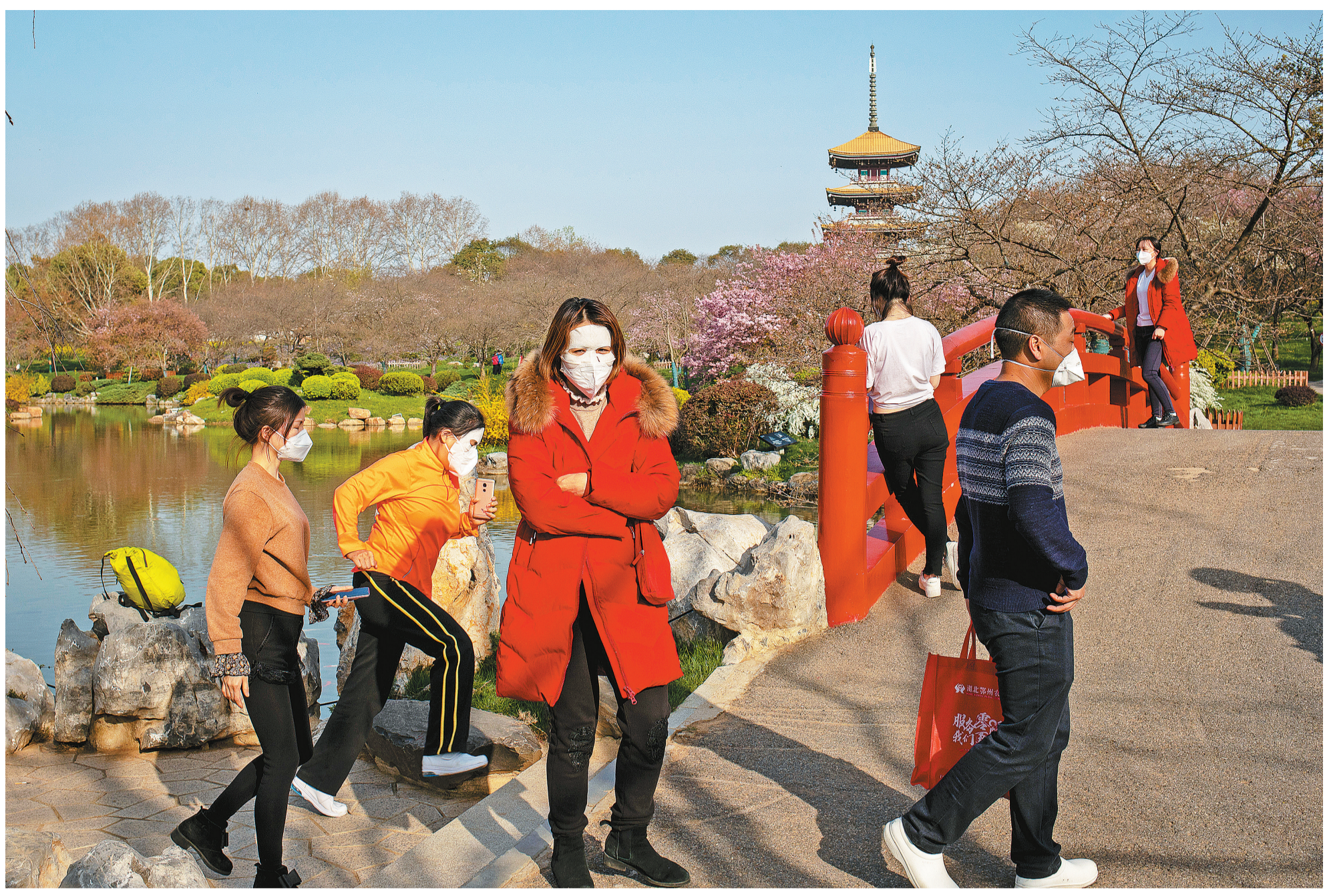
武汉春日 2020年3月14日，湖北省武汉市东湖旁，两名广东医疗队的援鄂护士贴着面膜游园。此时武汉疫情形势有所缓解，部分援汉医护人员进入轮休状态。对于他们来说，半天的休息时间也是宝贵的。