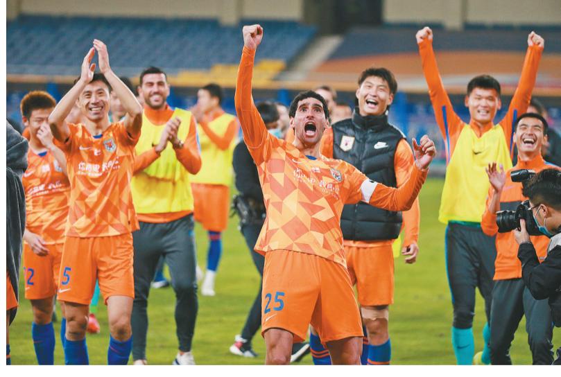
胜利 2020年11月10日，江苏苏州昆山体育中心，2020中超联赛第五名争夺战上，山东鲁能队战胜重庆队后，队员向台上的球迷致意。