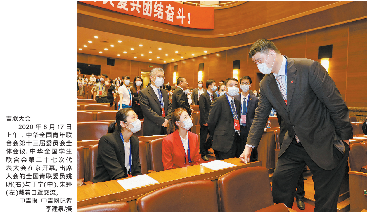
青联大会 2020年8月17日上午，中华全国青年联合会第十三届委员会全体会议、中华全国学生联合会第二十七次代表大会在京开幕。出席大会的全国青联委员姚明(右)与丁宁(中)、朱婷(左)戴着口罩交流。

2020年，中国足球超级联赛在疫情下缩减规模，入场球迷数量被大幅度限制，赛区还分成了绿区和蓝区，不能相互走动。好在略显空旷的看台，似乎也没有影响球迷和球员的激情。