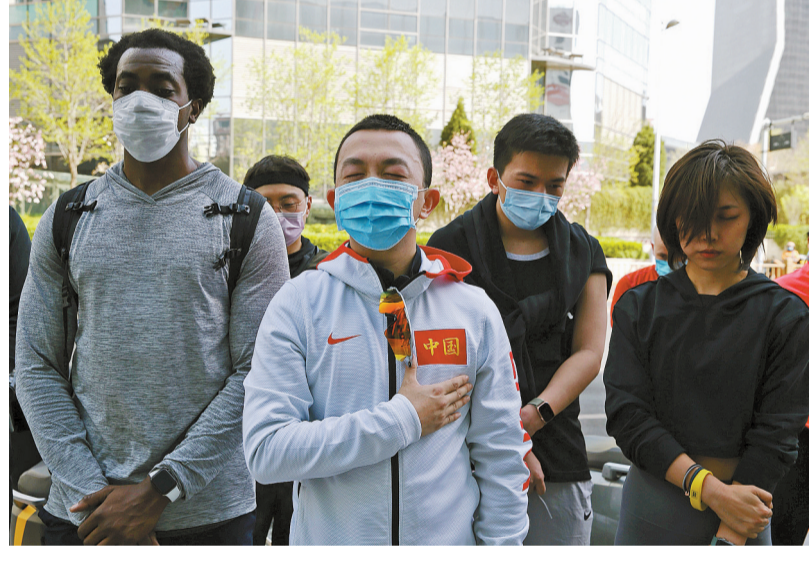
悼念 2020年4月4日清明节上午，北京CBD，年轻人默哀，悼念新冠肺炎疫情牺牲烈士和逝世同胞。