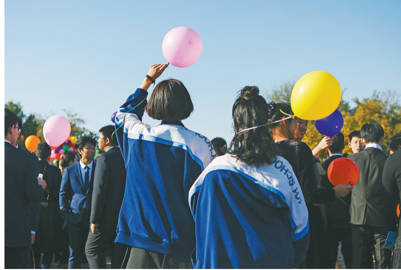
成长 2020年10月22日，北京圆明园遗址公园，北京一零一中学2020届高三毕业生成人仪式上，同学们准备放飞气球，庆祝迈入人生的新阶段。