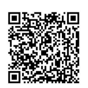
扫码观看更多 中青报记者的2020摄影手记