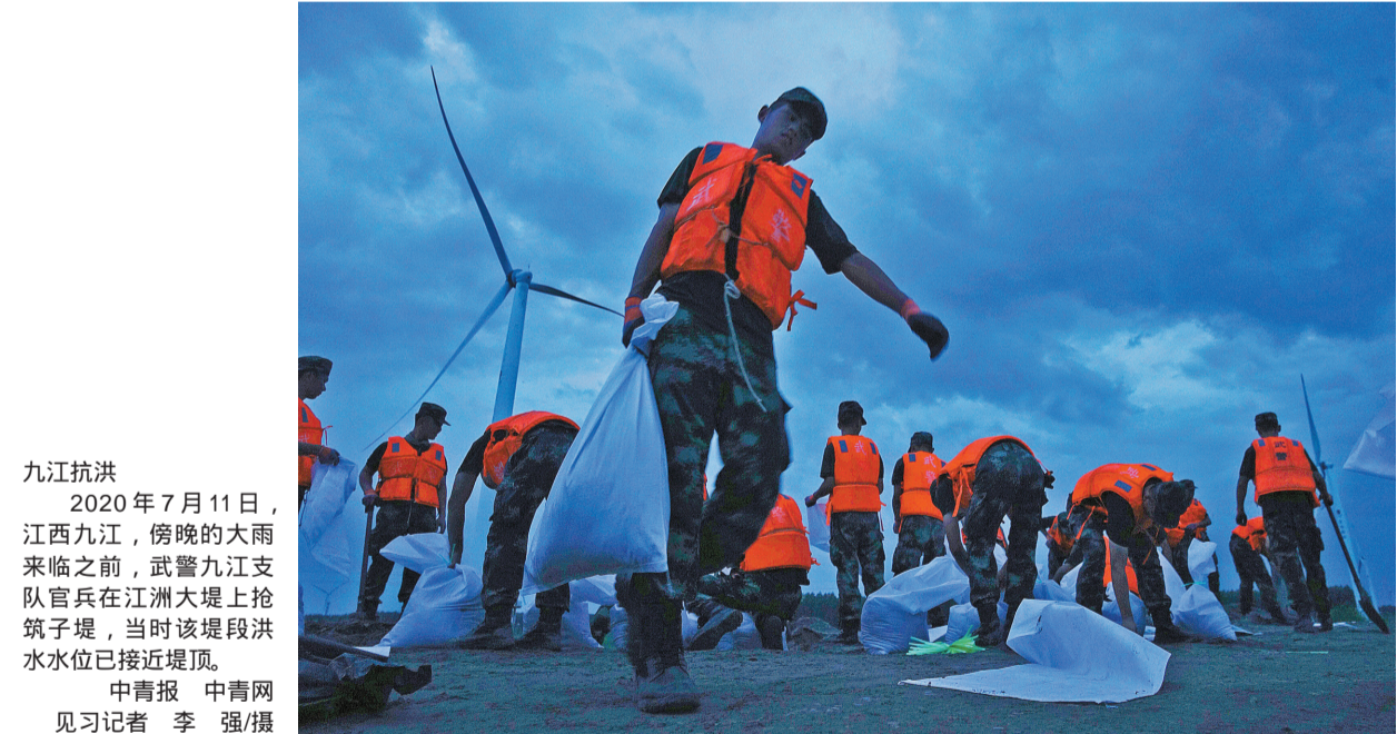
九江抗洪 2020年7月11日，江西九江，傍晚的大雨来临之前，武警九江支队官兵在江洲大堤上抢筑子堤，当时该堤段洪水水位已接近堤顶。

清明节过后，疫情有所缓解。进入6月，北京被突如其来的疫情击中。6月13日凌晨，北京新发地批发市场因新冠疫情暴发暂时休市。当日上午我赶到现场采访，第二天核酸检测结果阴性，但仍需居家隔离14天。其间我看着健康码从绿变黄，在隔离中度过了结婚纪念日。