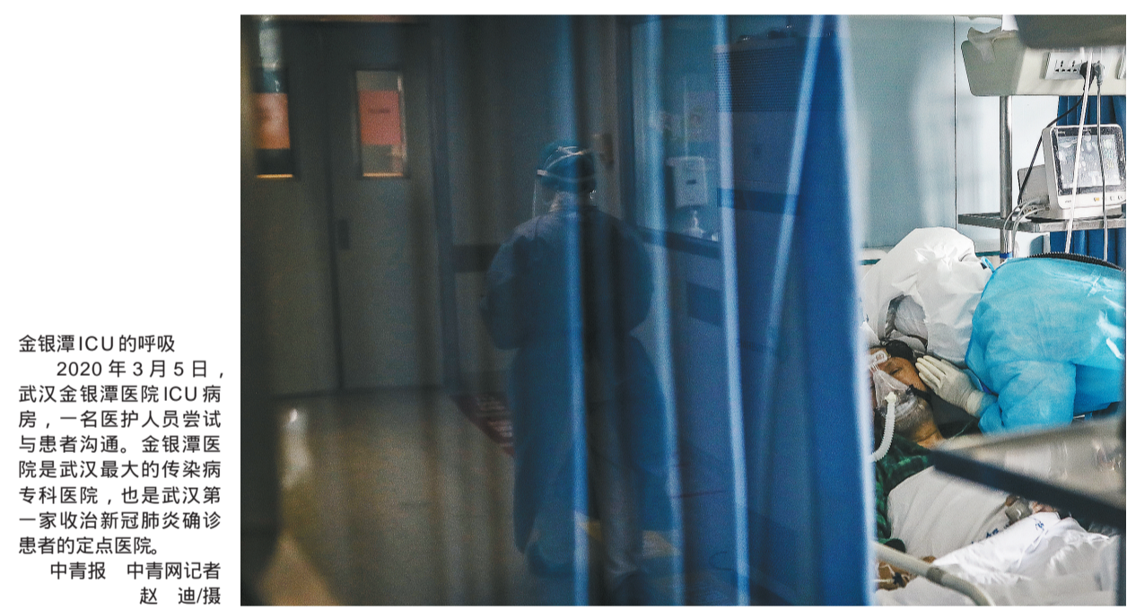
金银潭ICU的呼吸 2020年3月5日，武汉金银潭医院ICU病房，一名医护人员尝试与患者沟通。金银潭医院是武汉最大的传染病专科医院，也是武汉第一家收治新冠肺炎确诊病例的定点医院。