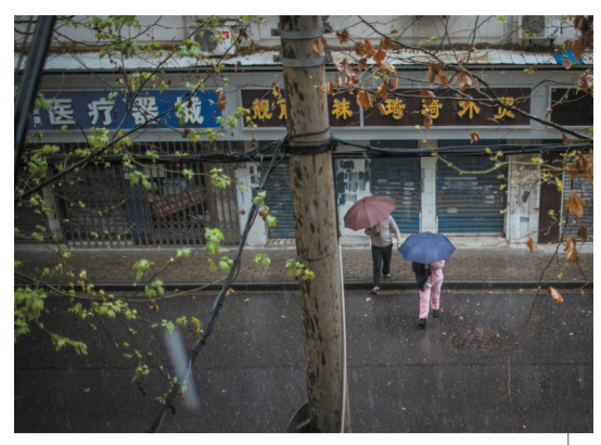
武汉人家 2020年3月26日，湖北武汉，梁倩下楼去接散步的父亲回家。

她的父母先后被确诊为新冠肺炎，母亲因病去世，父亲症状较轻，结束治疗和隔离后回了家，但似乎仍未摆脱感染者的身份。家中有人来访时，即使是暴雨天，父亲也会坚持下楼回避。不到两周后，离汉通道重启，许多武汉人被疫情改变的生活逐渐回归日常。