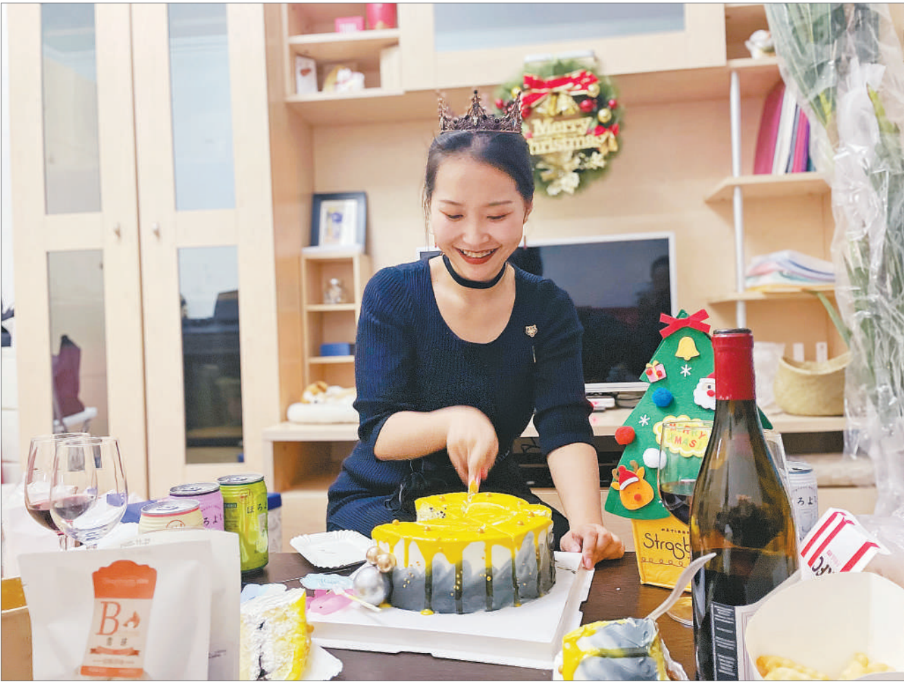
作者在新租的一居室过生日。

竖起耳朵听被占用的洗手间什么时候开门,随时准备冲过去。我在家写稿需要安静,但是每天都有快递员和外卖员咚咚咚地敲门。我从不吸烟,房间里却时常弥漫烟味。