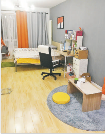
租金每月4600元的厅卧,去年春节回家前的照片。

我回到了三环,在离国贸一站地铁的地方租了一间厅卧。客厅隔断的好处就是面积大,这一间有26平方米,和一个小开间差不多,放得下朋友送给我的电钢琴。价格自然也很贵,一个月要付4600元。房子一共是三层,小房间还没租出去,另一个房间住了一对很好相处的情侣。他们把自己