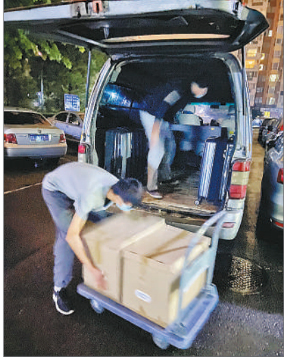
作者同事和搬家师傅一起搬东西。