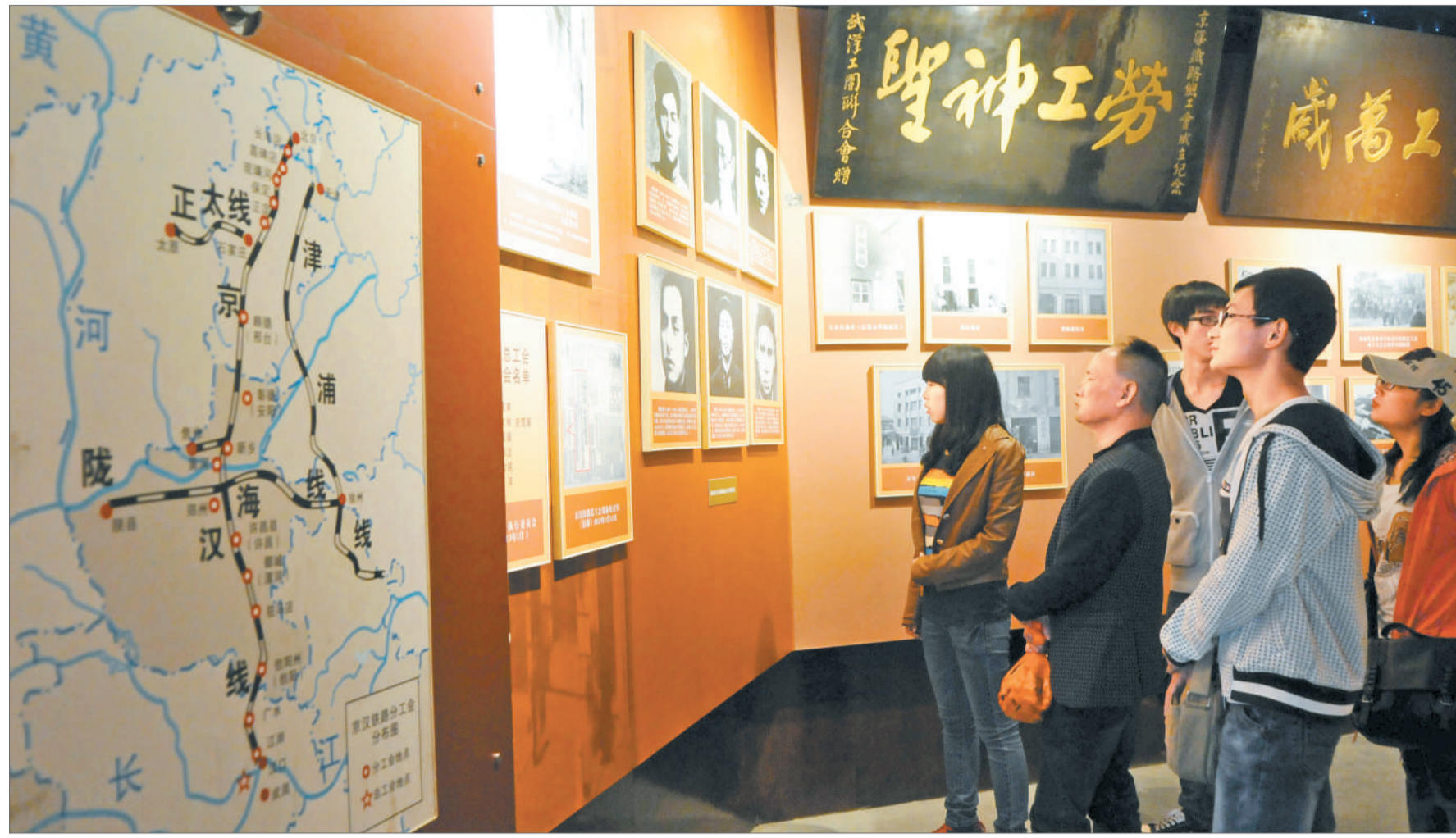
2014年4月6日,观众在郑州二七纪念馆里参观。清明小长假期间,人们来到郑州二七纪念馆,缅怀先烈,重温革命传统,感受红色精神。