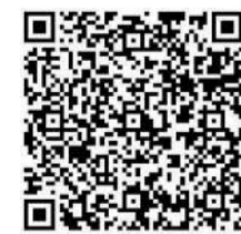
扫一扫 看视频 中国工人革命运动策源地