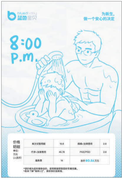
蓝色宝贝 网站提供定制代孕服务。

1月19日,记者发现该App中蓝色宝贝入口已经替换成健康百科,蓝色宝贝官网也已搜索不到。