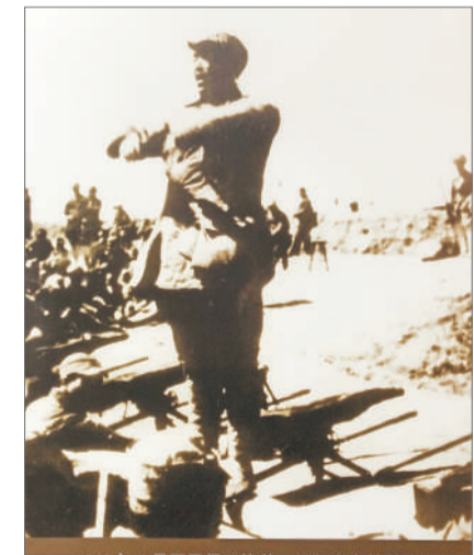
四平战役中，牺牲职务最高的将领是辽吉纵队独立一师师长马仁兴。四次战役，他参加过三次，在攻坚战中不幸中弹牺牲，年仅43岁。

据了解，在四平战役中，东北民主联军共牺牲1万多人，有师长、团级干部、营级干部，还有很多很多没有留下姓名的年轻战