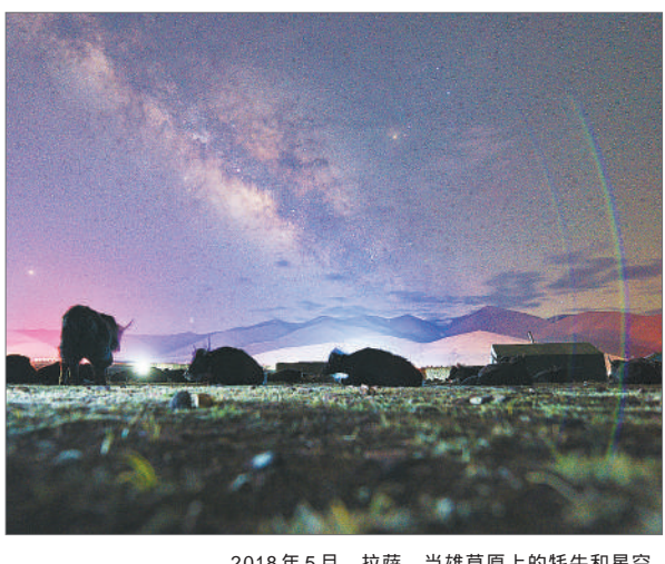
2018年5月,拉萨,当雄草原上的牦牛和星空。(资料图片)

这是我迷上科幻作品的原因,它就像明亮的恒星,在我的生命中闪烁着无比绚烂的光芒!(指导教师 倪翠坤)