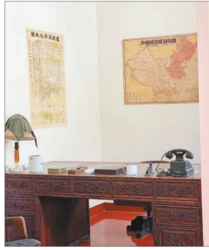
毛泽东在香山的书房里, 挂着两幅地图。

1948年12月21日至1949年1月16日全军后勤工作会议所制订的供给标准, 从战士到军委主席、总司令, 每人每月发一斤猪肉。有人发牢骚说, 人家大米加猪肉, 又住北京饭店, 我们是青菜加小米, 住小房子。革命20多年, 还不如资产阶级民主人士, 连个代表都当不上。甚至有人说 老革命不如新革命, 新革命不如不革命, 不革命不如反革命。