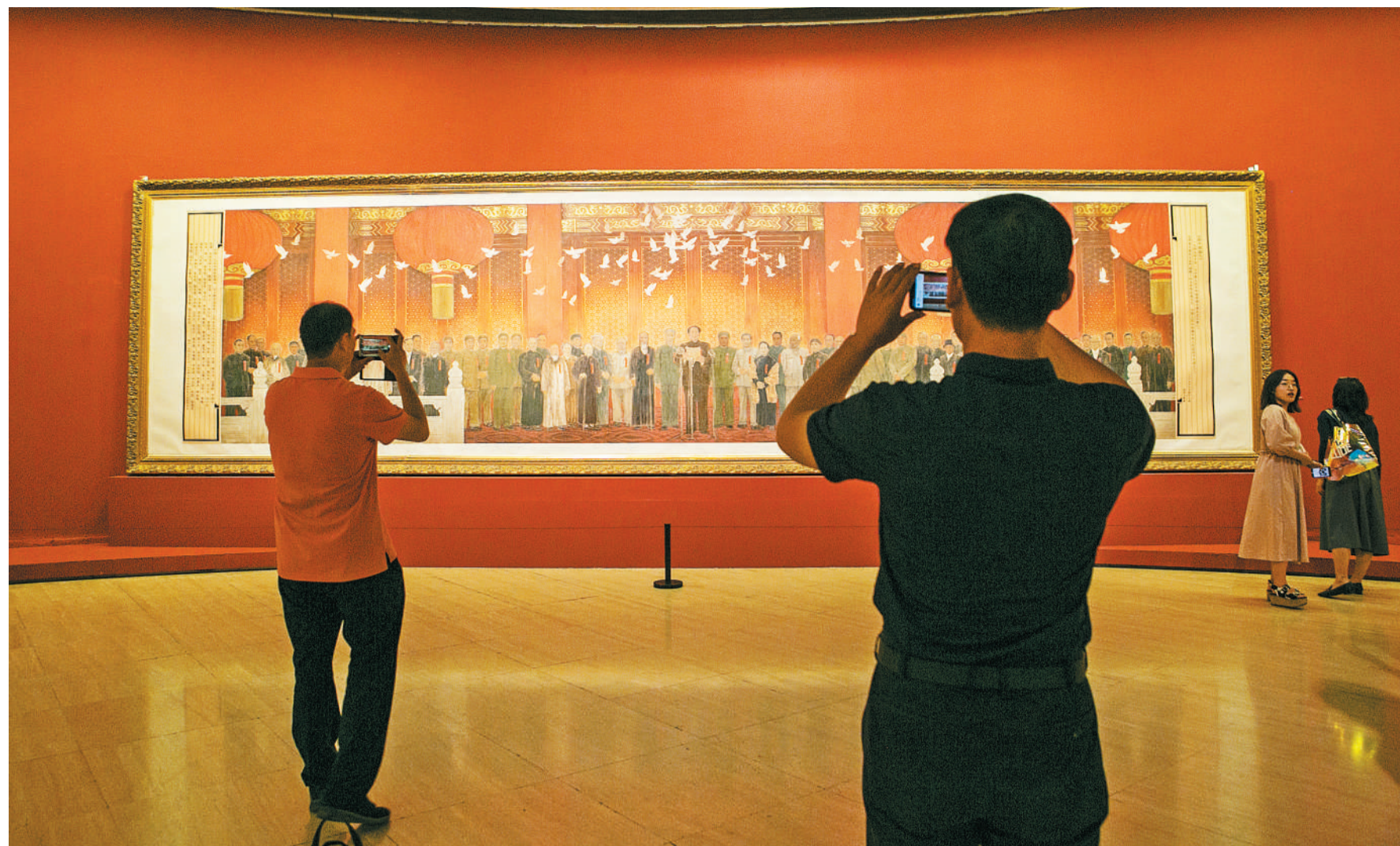
2019年9月26日 中国美术馆, 伟大历程 壮丽画卷 庆祝中华人民共和国成立70周年美术作品展上, 观众在开国大典题材的画作前驻足拍摄。