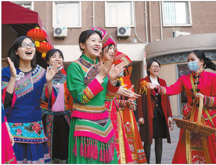
2月9日，广西壮族自治区人民政府驻北京办事处，身着民族服装的广西籍年轻人参加抛绣球活动。当日，为了让在京过年的年轻人感受到家乡的温暖和年味儿，国家机关事务管理局、团北京市委与广西驻京办联合开展“连线送福 留京青年走访慰问”活动。