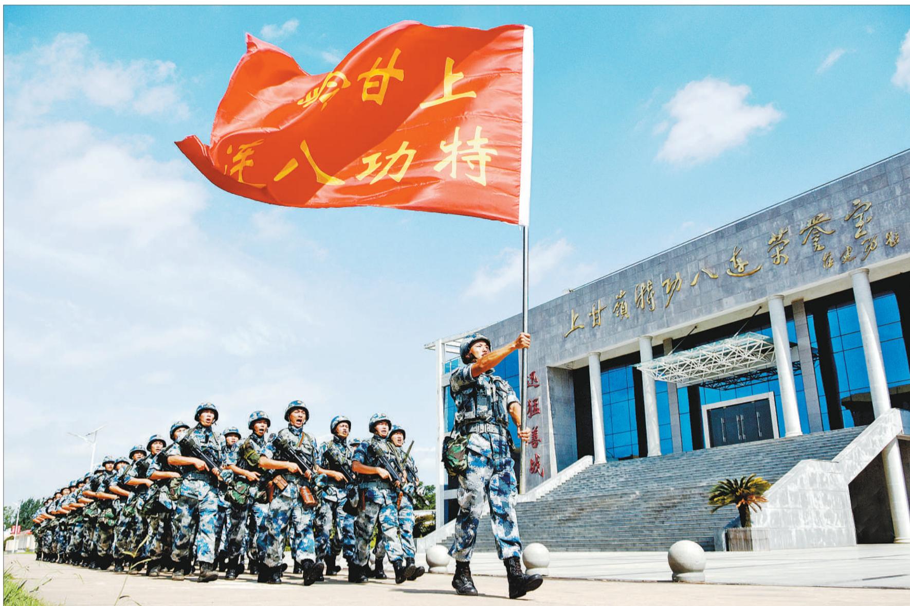
上甘岭战旗高高飘扬。