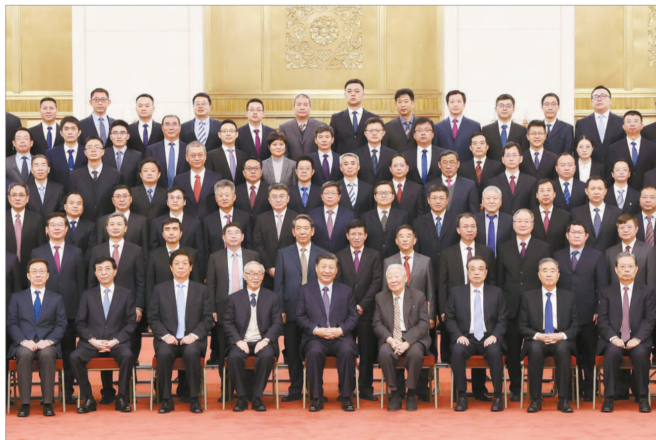
2月22日，党和国家领导人习近平、李克强、栗战书、汪洋、王沪宁、赵乐际、韩正等在北京人民大会堂会见探月工程嫦娥五号任务参研参试人员代表并参观月球样品和探月工程成果展览。这是习近平等会见探月工程嫦娥五号任务参研参试人员代表。