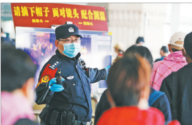
2021年春运期间,北京西站派出所民警在一楼大厅维护旅客进站秩序。

肖赞解释说,冲动指的是在列车运行过程中,在运行方向上产生的向前或者向后瞬时的加速度,就像新手司机开