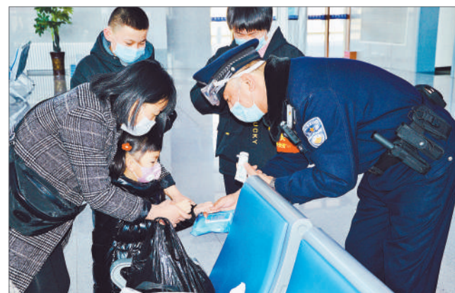
山西天镇车站派出所民警与防疫人员一起为旅客群众讲解防疫消毒知识。