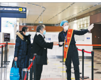
数据显示,2021年春节假期期间,北京首都、大兴两大机场共起降航班4593架次,共运送进出港旅客35.78万人次。

入冬以来,北京经历了自1966年以来最低温度的极寒天气,很多人都感慨北京这个冬天可谓“冷彻心扉”。时不时飘起的雪花,给机场日常的运行工作进一步增加了困难。