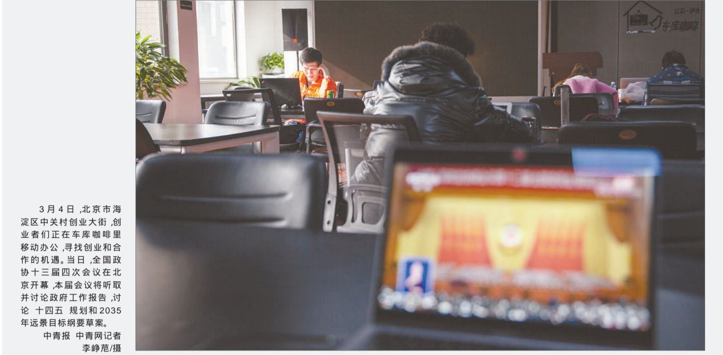
3月4日,北京市海淀区中关村创业大街,创业者们正在车库咖啡里移动办公,寻找创业和合作的机遇。当日,全国政协十三届四次会议在北京开幕,本届会议将听取并讨论政府工作报告,讨论十四五规划和2035年远景目标纲要草案。

用中央本级财政支出上的负增长换取增加对地方的转移支付,让更多的钱用到基层,用到民生支出、市场主体的保障上,这是未来财政施行的方向。