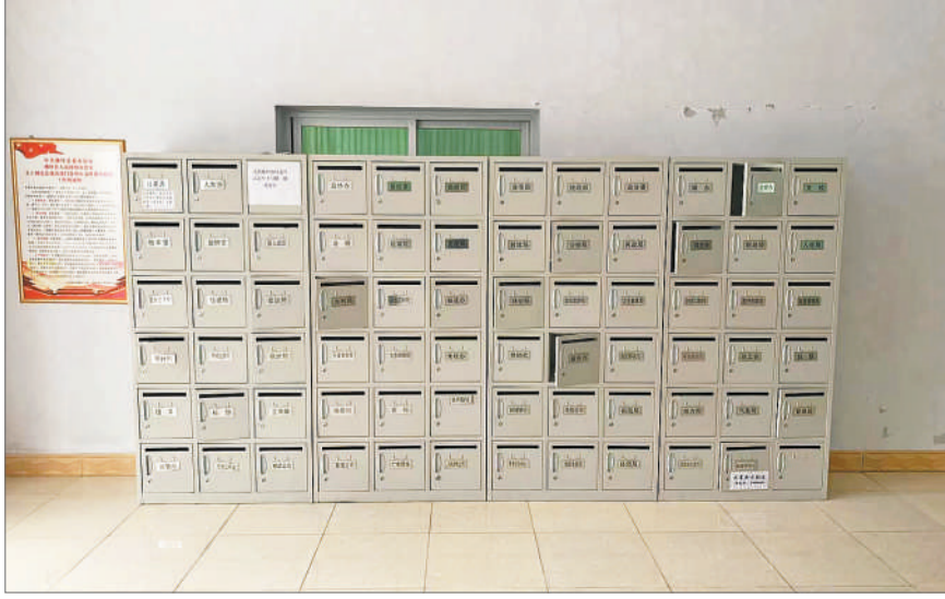
政府楼里各部门的信箱。