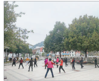
县城跳广场舞的人。