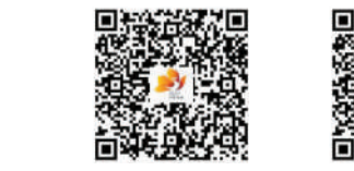
《广东省佛山市顺德区系列人才政策》