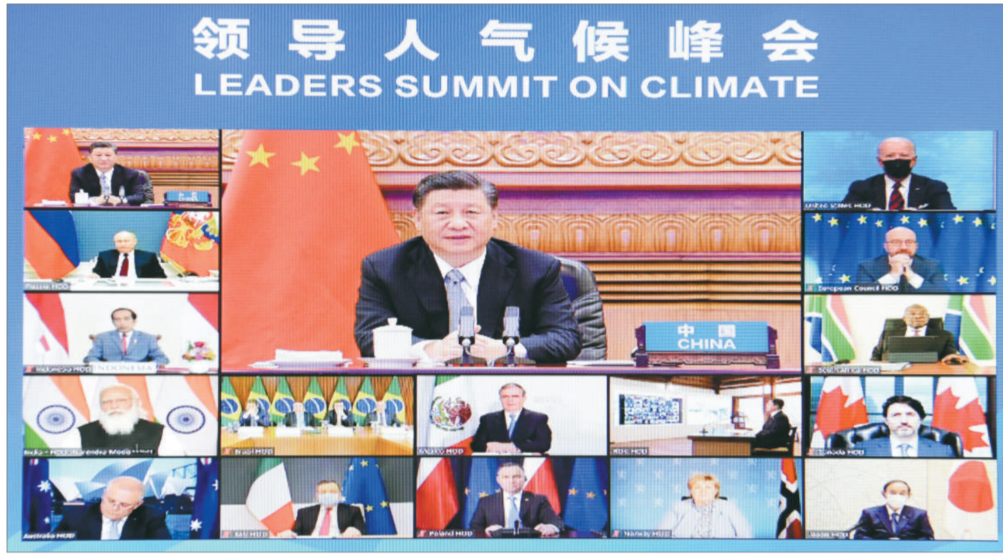
4月22日晚，国家主席习近平发表题为《共同构建人与自然生命共同体》的重要讲话。