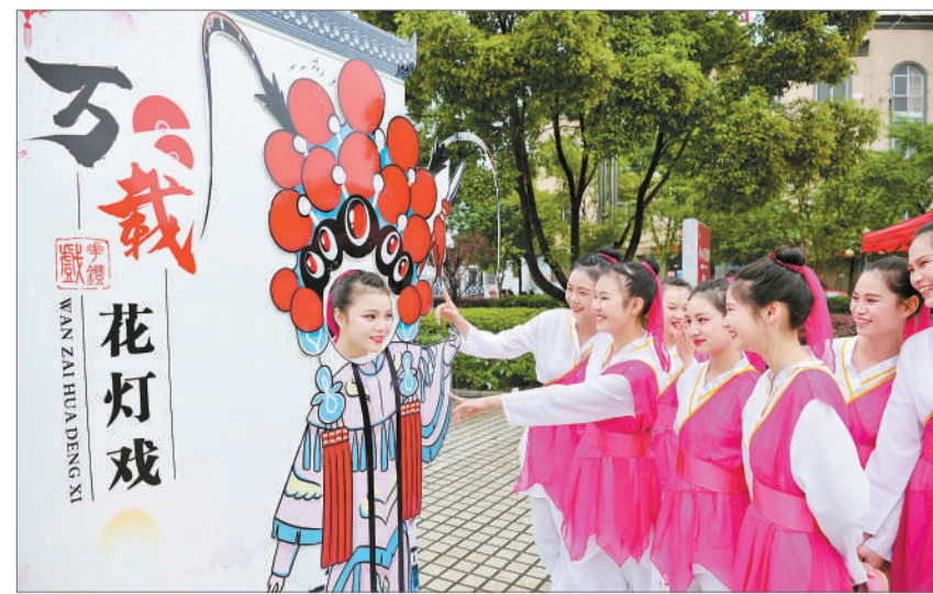
4月27日,为庆祝中国共产党成立100周年,江西省宜春市万载县在文化广场举办“传承花灯戏 追忆红色情”为主题的课间操大赛,吸引了全县多支队伍参加比赛。图为学生在文化广场花灯戏展示板前玩耍。

目前团队已经做出包括56个民族的笑脸在内的大部分素材,张胜迪表示,这也是对习近平总书记那句“政策好不好,要看乡亲们是哭还是笑”的回应。