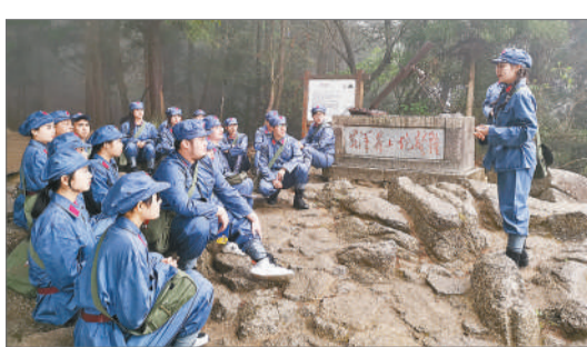
4月6日-7日,井冈山大学映山红青年学院“四史”读书班学员赴井冈山开展红色寻访活动,学员们围坐在岩石上,聆听黄洋界保卫战的历史。