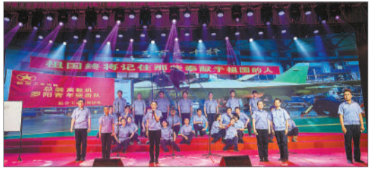
4月9日,团江西省委举办的各属青年庆祝建党100周年歌咏大赛省直组决赛现场,中航工业洪都集团公司团员青年代表表演节目《把酒干好》。