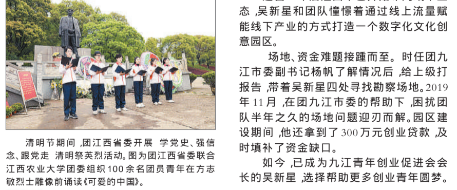
清明期间,团江西省委开展“学党史、强信念、跟党走”清明祭英烈活动。图为团江西省委联合江西农业大学团委组织100余名团员青年在方志敏烈士雕像前诵读《可爱的中国》。