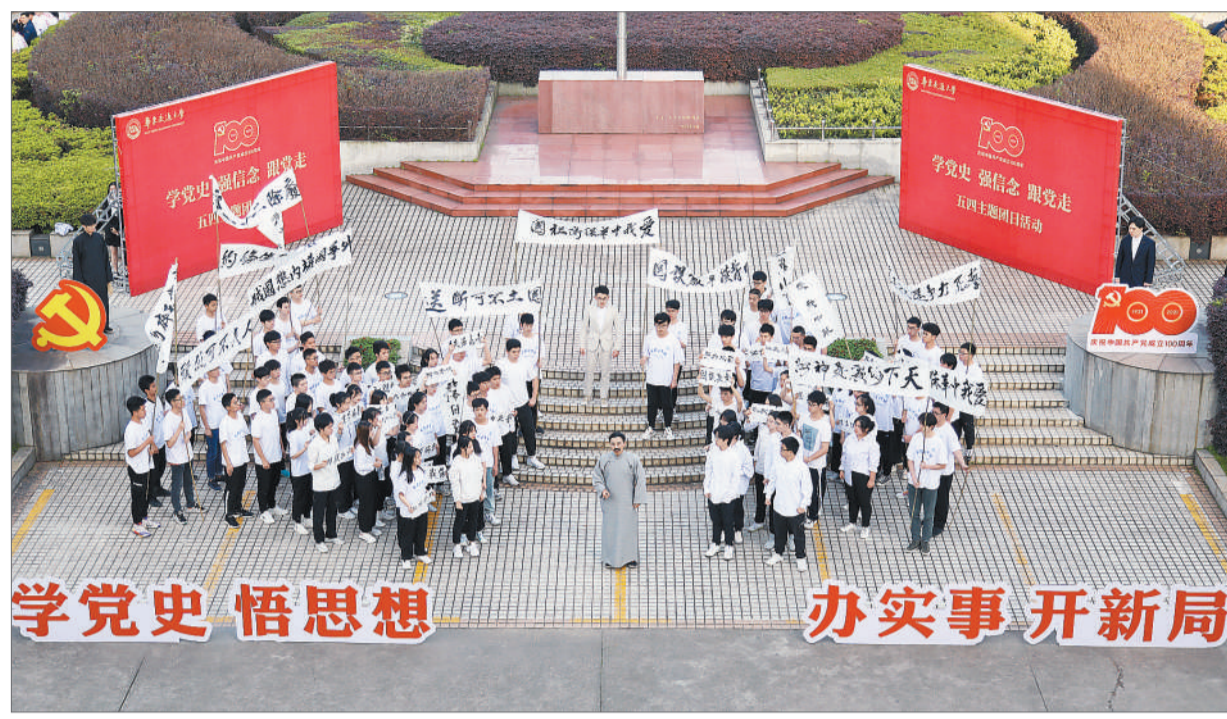
4月30日,华东交通大学开展“学党史、强信念、跟党走”五四主题团日活动,百名团员青年走到广场,以热血快闪《五四曙光》还原1919年五四运动场景。