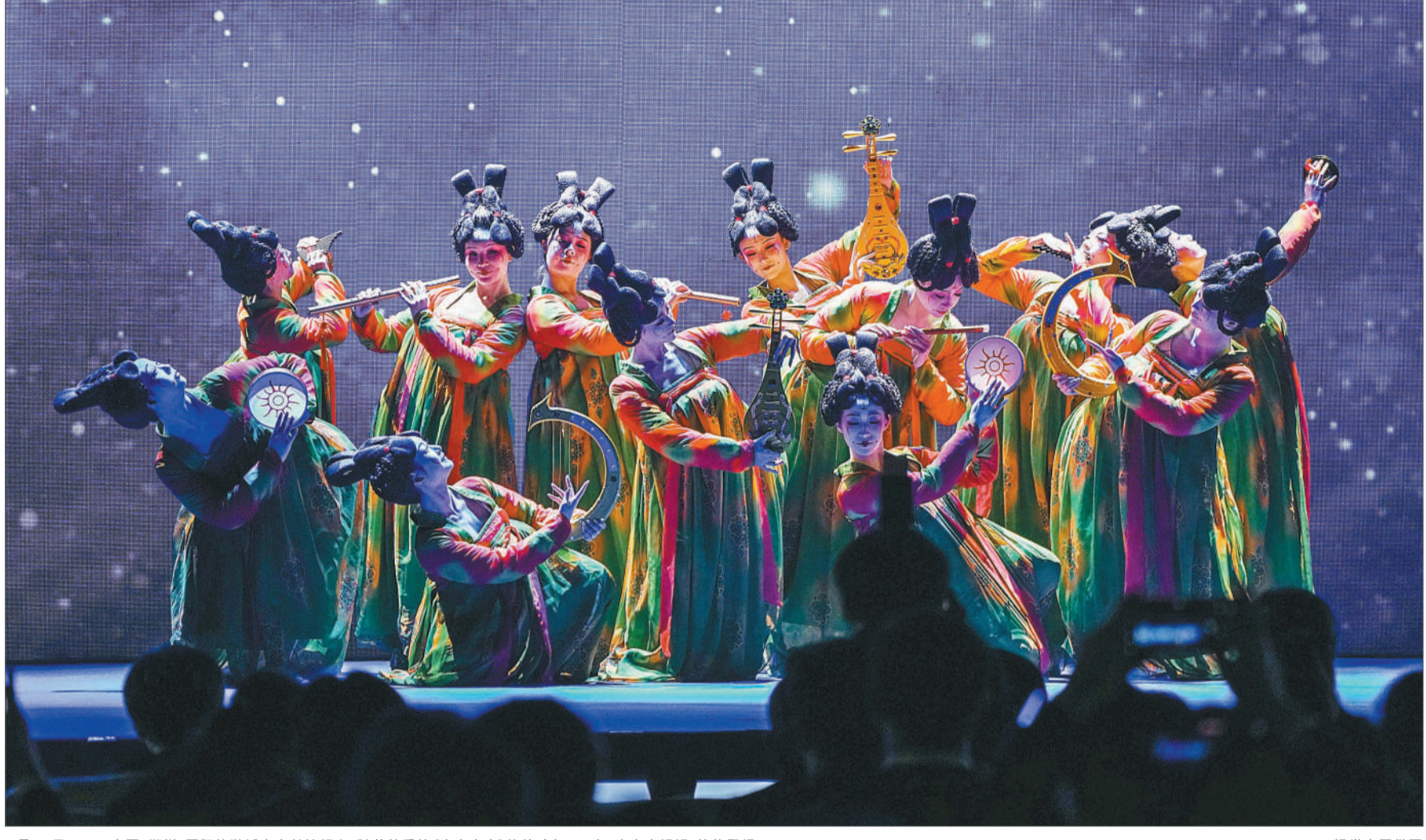
4月21日,2021中国(郑州)国际旅游城市市长论坛上,随着熟悉的《唐宫夜宴》旋律响起,14名唐宫小姐姐惊艳登场。