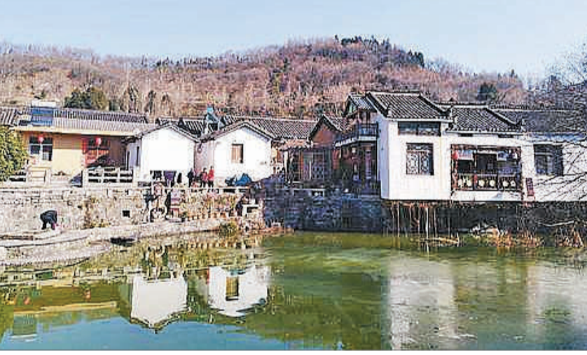
近年来,群山环绕的河南新县田铺大湾依托红色文化和绿水青山两大资源,积极发展乡村旅游业。在田铺大湾,村里的民居和景区是相融合的。图为田铺大湾村景。

位于新县城南白毛尖的鄂豫皖苏区首府烈士陵园内,松柏环抱,绿荫满园,安静庄严。站在陵园抬头望远,对面不远处的英雄山上,红旗飘飘,雕塑横亘天地,鲜艳灿烂。那就是红旗不倒的象征。讲解员轻轻地诉说,简短有力。