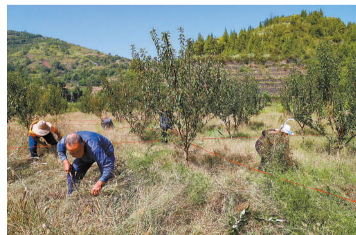
2018年9月23日,安静村首个农民丰收节,村里组织了首届乡村趣味运动会,村民正在参加除草比赛。运动会上的项目都是大家商议出来的。