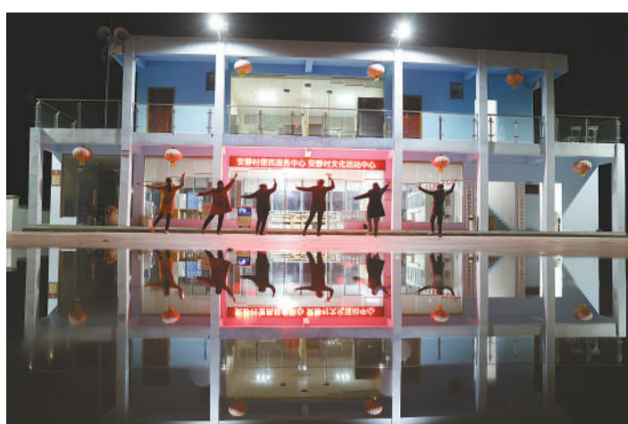
2021年4月7日,重庆市巫山县双龙镇安静村便民服务中心,村里建立了一支文艺队,晚上大家自发组织起来在村委会院里跳起坝坝舞。