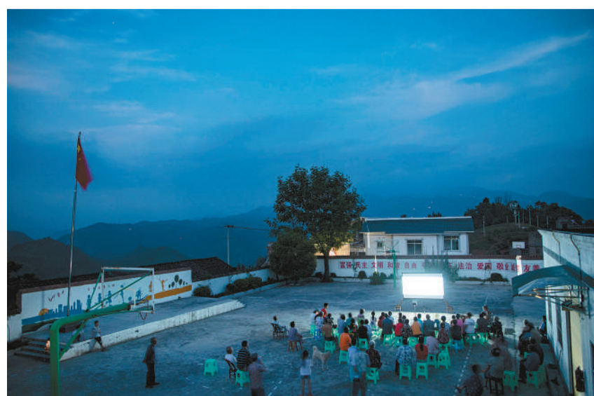
2018年6月13日,安静村钱家小学油坊教学点,驻村工作队用投影仪播放露天电影,丰富村民的文体生活。