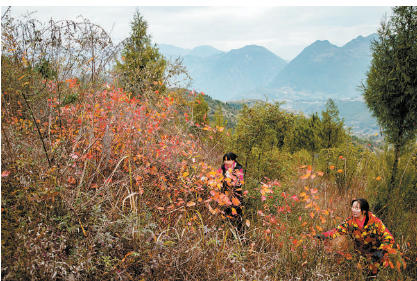
2018年12月8日,重庆市巫山县双龙镇安静村,两位村民在山坡上采摘红叶。村里发展红叶叶雕文创产业,带动村民实现就近务工,脱贫增收。