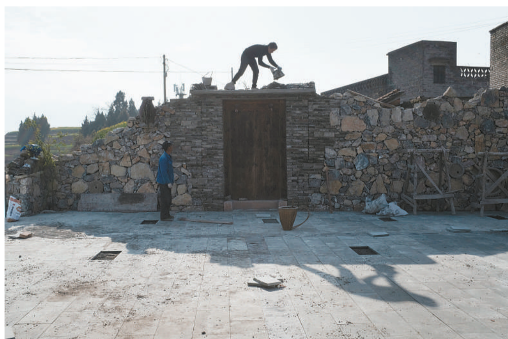
2019年3月12日,重庆市巫山县双龙镇安静村,村民在修建文化艺术墙。

2020年,在重庆市举办的中国国际智能产业博览会上,安静村的红叶书签传到了各国来宾手中。离任前,王涛和接任的第一书记还在探讨扩大消费扶贫范围的可能性。这场实验,仍在安静村进行着。