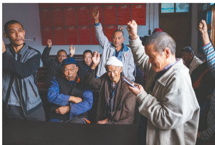
2017年10月18日,为了吸引游客,安静村要修建旅游步道,需要无偿占用部分山地。村民们为了吃上旅游饭,召开一事一议会议,举手表示赞同。