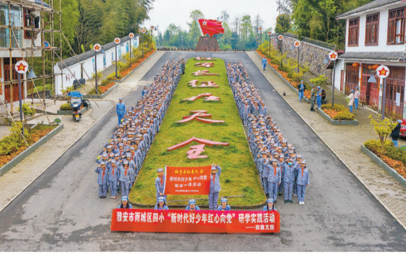
上图:四川省雅安市雨城区四小的师生走进雅安市委实践基地天全县红军村,开展 新时代好少年红心向党 研学实践活动。

用年轻人喜闻乐见的话语体系来表达,用青少年易于接受的形式来传播。团四川省委宣传部部长张静说,要用这样的方式提高以党史教育为重点的 四史 教育对青少年的感召力,让知识真正动起来、活起来,讲好从 一叶红船 到 巍巍巨轮 的红色故事。