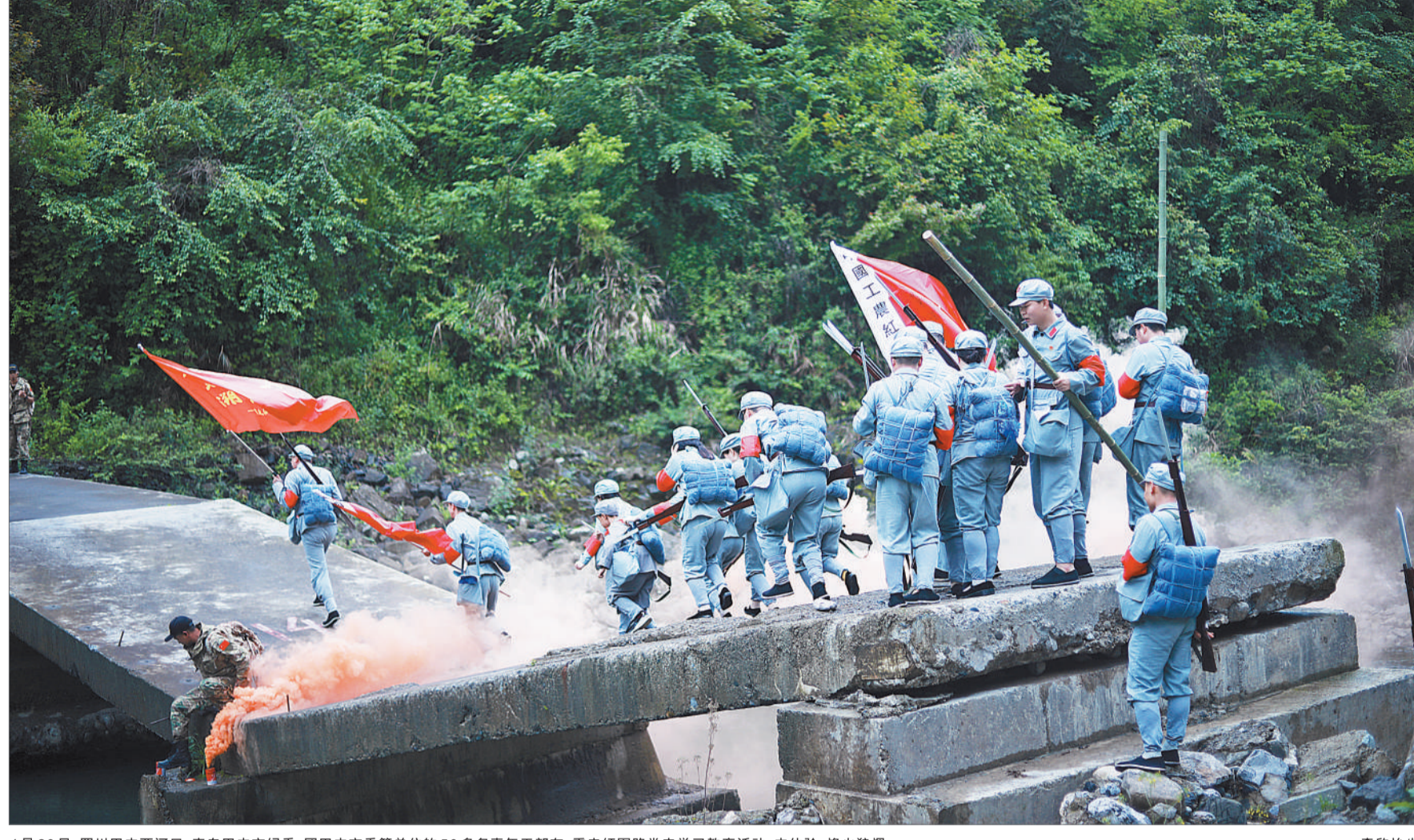
4月20日,四川巴中两河口,来自巴中市纪委、团巴中市委等单位的50多名青年干部在重走红军路党史学习教育活动中体验烽火狼烟。