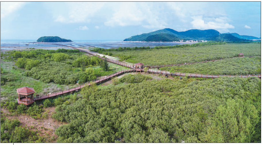
广东省阳江市海陵岛红树林国家湿地公园

2021年6月5日,阳江,2021年世界环境日,著名干邑品牌马爹利正式启动在中国的可持续发展与社会责任项目——红树林生态系统保护,致力于扩大红树林湿地面积并恢复其独特的自然风貌。为积极响应政府对于生态修复和保护生物多样性的号召,马爹利在广东省阳江市海陵岛开展红树林保护和修复工作,计划在第一年种植和抚育约1.8万株红树,以实际行动助力阳江市创建国家森林城市。