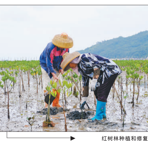
红树林种植和修复

在阳江市海陵岛开启的红树林保护和修复项目也得到了当地政府部门和居民的热烈欢迎。马爹利将为我们本地开展的红树林保护工作提供大力帮助,项目的开展也将进一步提升森林覆盖率,帮助阳江市实现创建国家森林城市的目标,对此我们深表感谢。阳江市海陵岛红树林国家湿地公园管护中心主任表示:希望该项目能引导更多企业和机构来到我们美丽的海陵岛开展生态保护和修复工作,一起为保护红树林贡献力量。