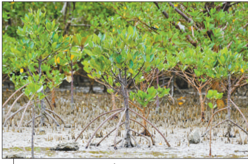
红树林湿地生态系统

在阳江市海陵岛开启的红树林保护和修复项目也得到了当地政府部门和居民的热烈欢迎。马爹利将为我们本地开展的红树林保护工作提供大力帮助,项目的开展也将进一步提升森林覆盖率,帮助阳江市实现创建国家森林城市的目标,对此我们深表感谢。阳江市海陵岛红树林国家湿地公园管护中心主任表示:希望该项目能引导更多企业和机构来到我们美丽的海陵岛开展生态保护和修复工作,一起为保护红树林贡献力量。