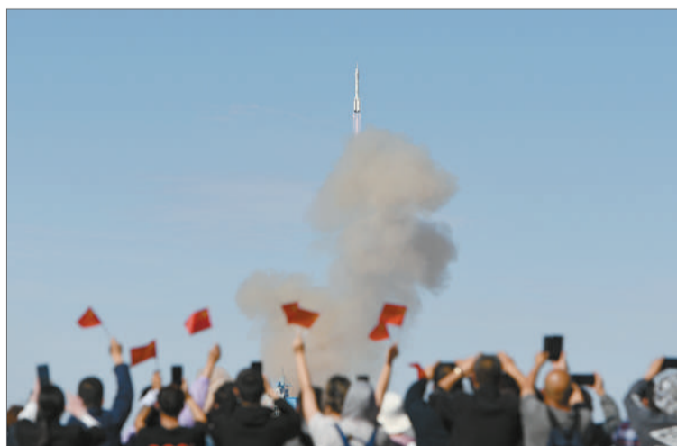
上图：在北京航天飞行控制中心拍摄的进驻天和核心舱的航天员向全国人民敬礼致意的画面。 新华社记者 金立旺/摄 左下图：在北京航天飞行控制中心拍摄的神舟十二号载人飞船航天员乘组进驻天和核心舱的画面。 新华社记者 金立旺/摄 右下图：6月17日9时22分，搭载神舟十二号载人飞船的长征二号F遥十二运载火箭，在酒泉卫星发射中心准时点火发射。 新华社记者 刘磊/摄