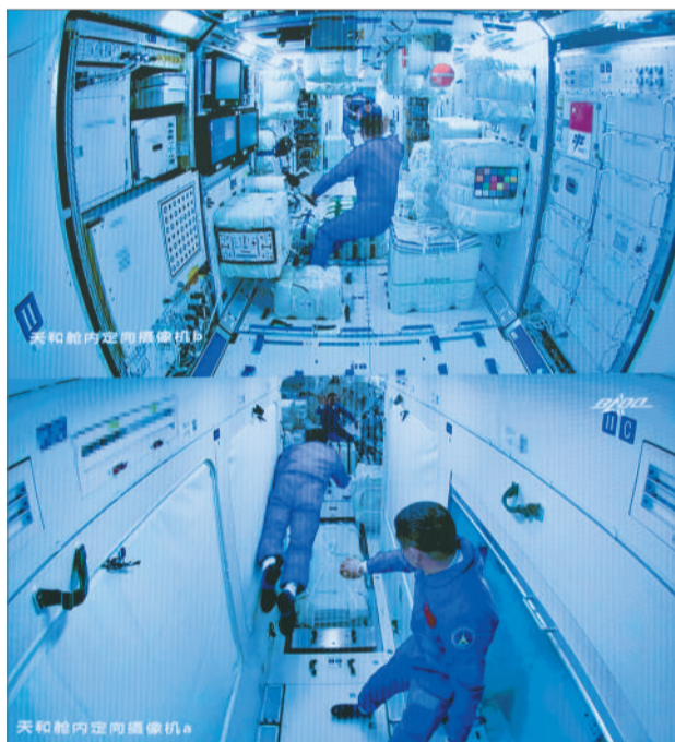
天和舱内定向摄像机