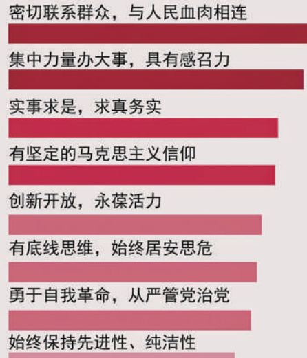
数据来源:中国青年报社社会调查中心 制图:孙山

本科毕业后,报名成为西部计划志愿者,来到西藏自治区,在那曲广播电视台工作,为此她推迟了一年研究生入学。