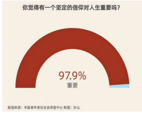
中青报 中青网记者 孙山 见习记者 王志伟

心中有信仰 脚下有力量。中国青年报社社会调查中心进行的建党百年全国青年调查显示,97.9%的受访者确认有坚定的信仰对人生是重要的,73.1%受访者表示中国共产党让自己