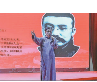
沈阳航空航天大学 沉浸式红色经典故事分享首演活动中，学生讲述李大钊的故事。