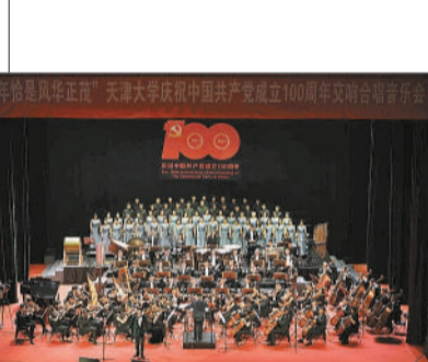
为庆祝中国共产党建党100周年，深入开展党史学习教育，天津大学联袂天津歌舞剧院精心策划了百年恰是风华正茂 庆祝中国共产党成立100周年交响合唱音乐会。