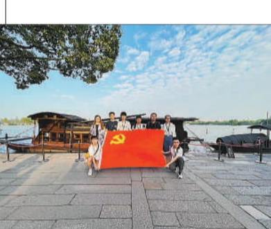
西安电子科技大学网信学院本科生第三党支部开展 瞻仰南湖红船，学习红船精神 主题党日。