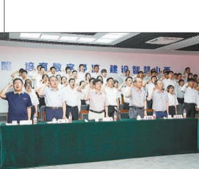
太原理工大学师生共同开展党史教育专题学习，全体党员举起右拳，面向党旗合唱歌曲《我宣誓》。