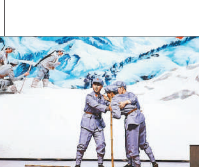
郑州大学 百年党史青年说 活动上，同学们表演主题话剧。