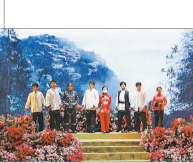
南昌大学 弘扬苏区精神，献礼建党百年 音乐党课《党的女儿》在校音乐厅内演出。