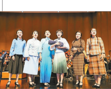
北京大学和清华大学联手制作、师生共同参与的交响清唱剧《江姐》在北京大学、清华大学连续进行了4场演出。