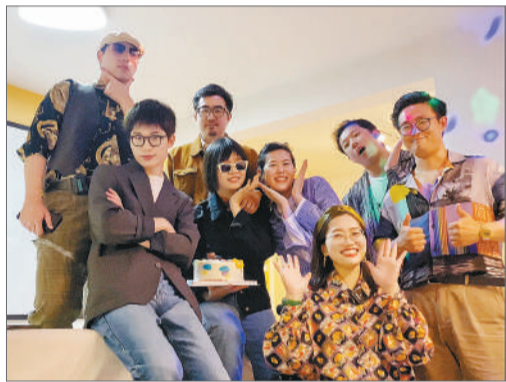
两人和朋友在家里蹦迪。