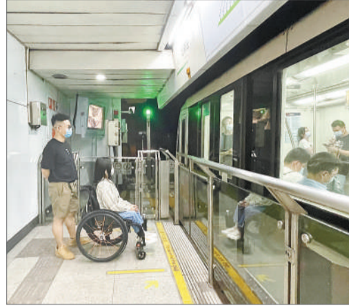
两人在地铁的第一节车厢候车,这里通常有轮椅位。