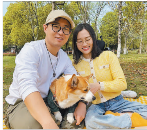
两人外出野餐。