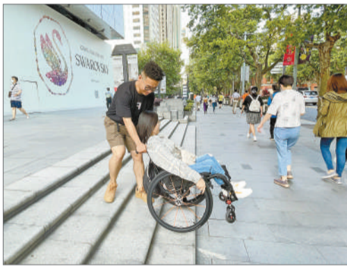
两人配合过台阶。