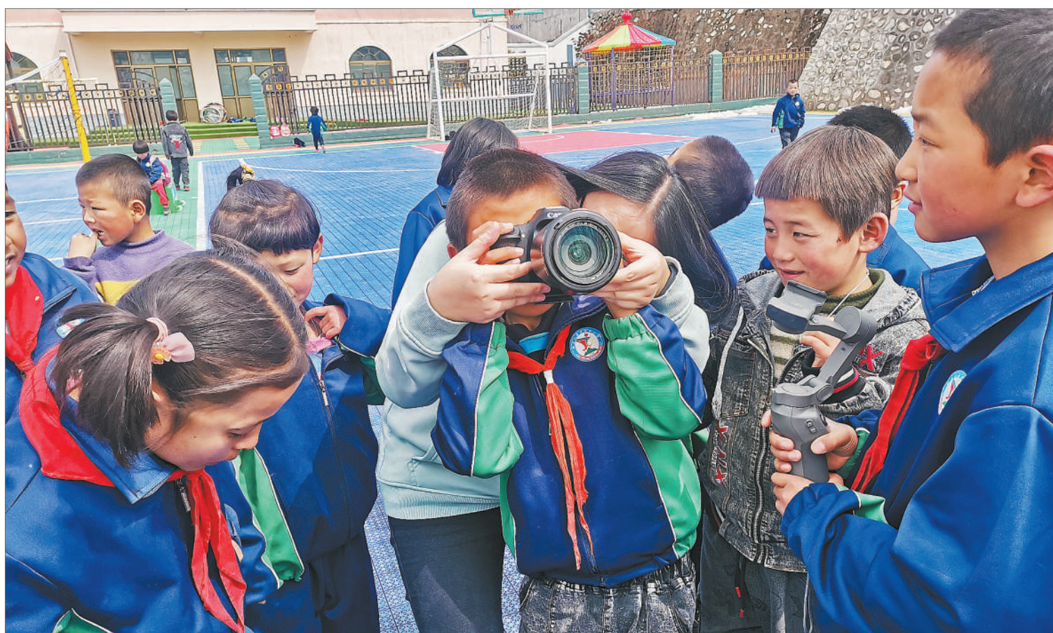
中咀岭小学的孩子们。