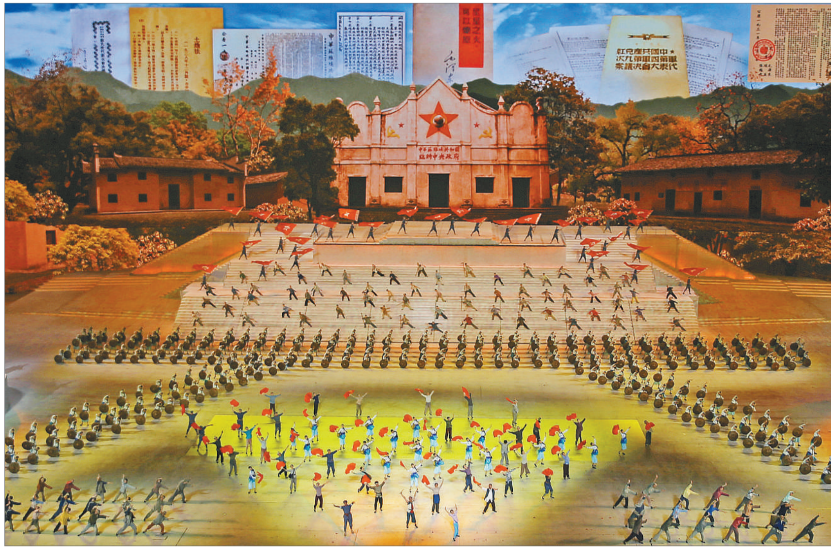
6月28日，北京国家体育场，庆祝中国共产党成立100周年文艺演出《伟大征程》演出场景。

2011年11月4日，习近平在纪念中央革命根据地创建暨中华苏维埃共和国成立80周年座谈会上的讲话