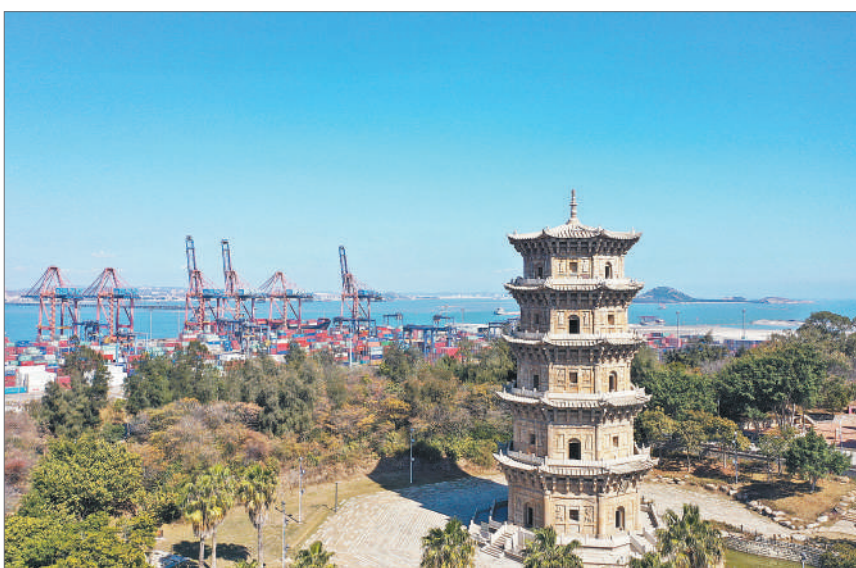
福建泉州,六胜塔见证了石湖港的发展历史。