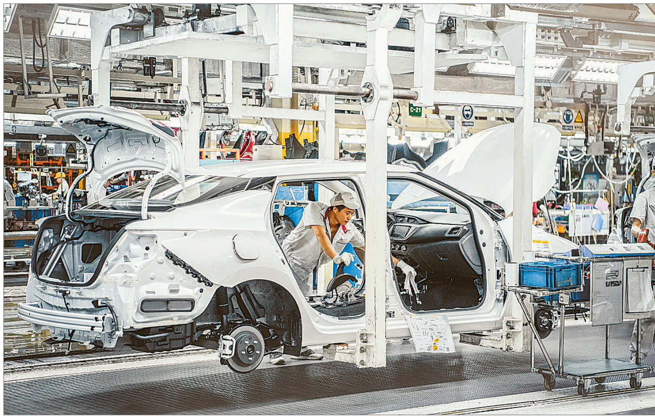
作为国内首家党建进章程的合资企业、首家实行党组织“两公开、两纳入”的合资公司，东风日产的党建工作和党群活动被认为是其能够战胜市场波动、不断推动企业高质量发展的秘诀之一。6月28日，在国资委公布的中央企业先进表彰名单中，东风日产荣获中央企业先进基层党组织荣誉。

方力量支援抗疫一线。东风日产向东风公司公益基金捐款300万元，组织4646名党员主动捐款48万元，21454名工会会员捐款123万元，积极协助集团采购口罩100万个。