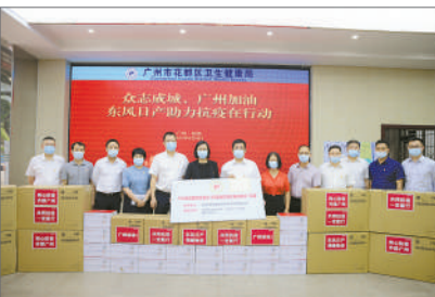
今年5月21日，广州市暴发新一轮本土疫情。作为企业公民，东风日产一方面快速响应，积极抗疫，并向花都慈善会捐赠了防疫物资；另一方面，广州市荔湾区多街道实施封闭式管理后，东风日产纯电动车利用无人驾驶技术运输物资，降低了人员运送物资的风险，让科技成为抗疫的有力武器。