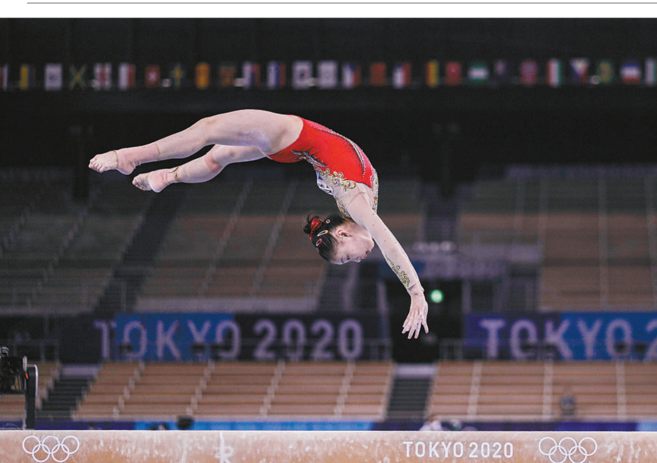
8月3日，中国小将管晨辰在东京奥运会体操平衡木的比赛中，技压群芳夺得冠军。

明年，亚运会、世锦赛等大赛又将接踵而至，缪仲一表示，中国体操队从走下领奖台的那一刻，一切备战工作就是新的开始。本报东京8月3日电