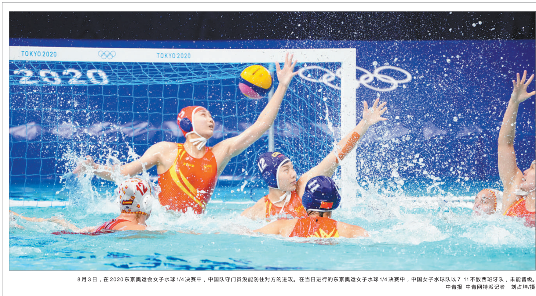
8月3日，在2020东京奥运会女子水球1/4决赛中，中国队守门员没能防住对方的进攻。在当日进行的东京奥运女子水球1/4决赛中，中国女子水球队以7:11不敌西班牙队，未能晋级。

体育营销专家张庆今天向中青报·中青网记者表示：东京奥运会上有一批获得很高关注度的中国运动员涌现，这与他们成绩优异又有明显的个人亮点有关。张庆评价：他们展现了中国新一代运动员的一些普遍特质，包括优异的竞技成绩、率真的个性等。他们无论是喜欢芭比娃娃，还是喜欢某一首歌，都展现出一种非常鲜活的个体。他（她）是世界冠军、奥运会冠军或者奥运会成绩非常优异，但